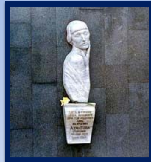
Одесса. Мемориальная доска Ахматовой

Анна Горенко (Ахматова - псевдоним, взятый, по собственным словам, в честь прабабушки, татарской княжны Ахматовой) родилась 11 (23) июня 1889 года под Одессой (Большой Фонтан). Её отец был в то время отставной инженер-механик флота. Годовалым ребенком она была перевезена на север - в Царское Село. Там она прожила до шестнадцати лет.