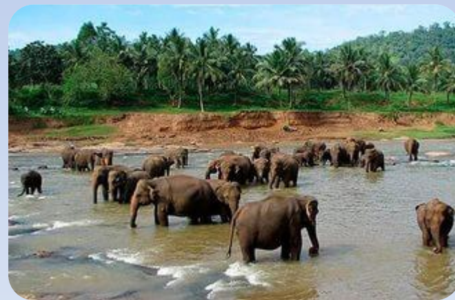
Пілдерді асырайтын орын Пиннавела