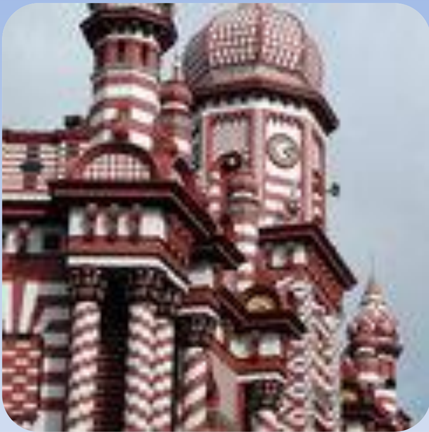
Джами Уль Альфар мешіті .