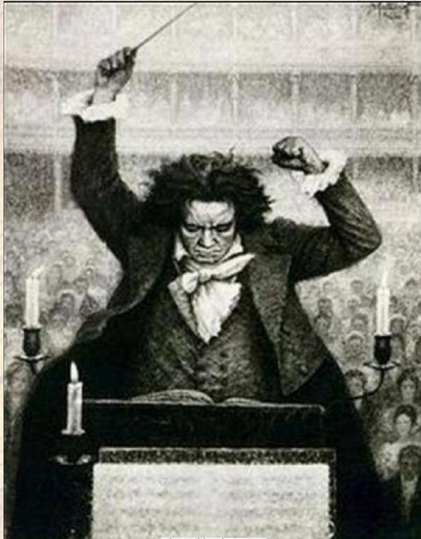
Людвіг ван Бетховен (1770 - 1827)

Він був останнім композитором XIX ст., для якого природною формою музичного вислову був жанр