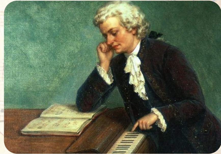
Вольфганг-Амадей Моцарт (1756 - 1791)