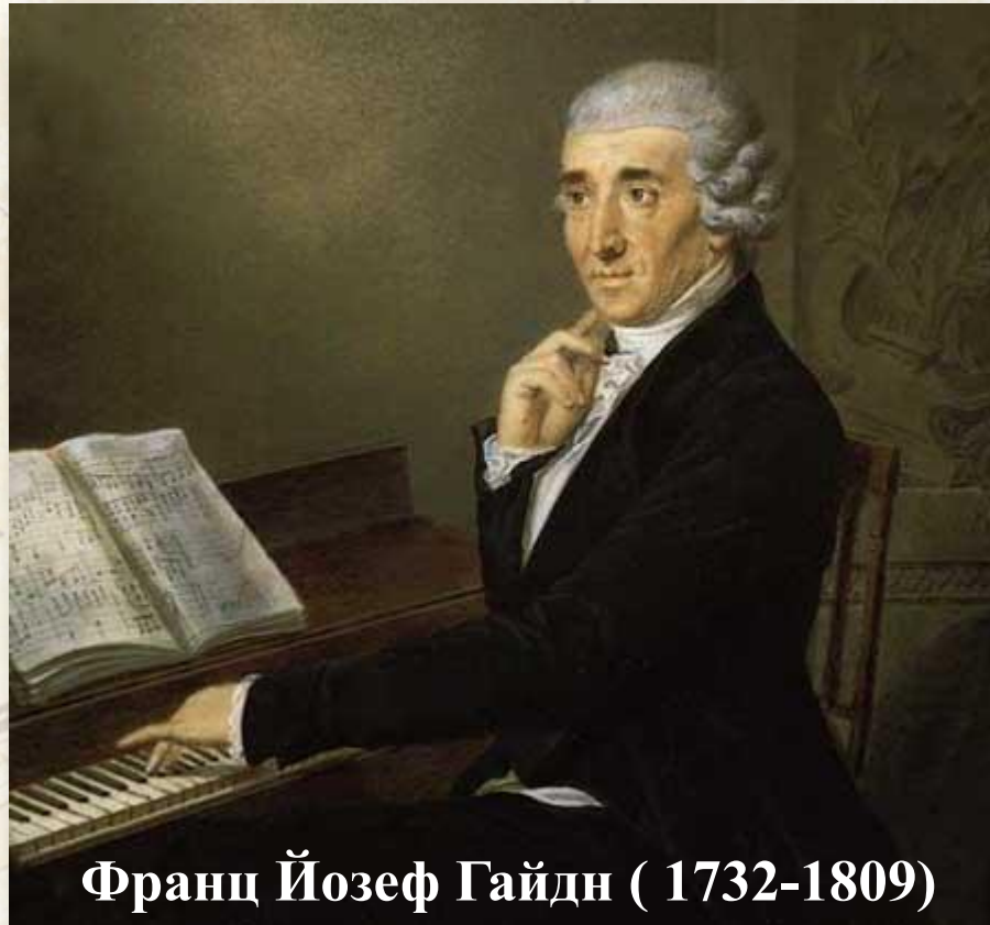
Франц Йозеф Гайдн (1732-1809)

Австрійський композитор, представник віденської класичної школи, один з основоположників таких музичних жанрів, як симфонія і струнний квартет.