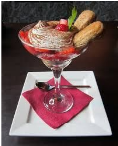
Десерт в мартинке