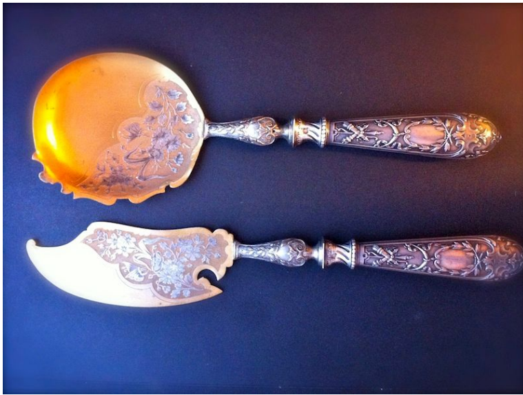
Десертные приборы XVIII век

Изначально французы так называли все, что подавалось после основного блюда. Сыр, фрукты, орехи, ягоды, соки – такими были первые незатейливые десерты.