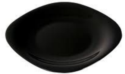
Десертная тарелка диаметром 20 см