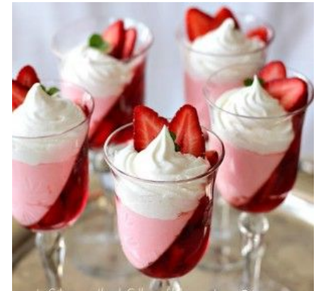
Десерт в бокале