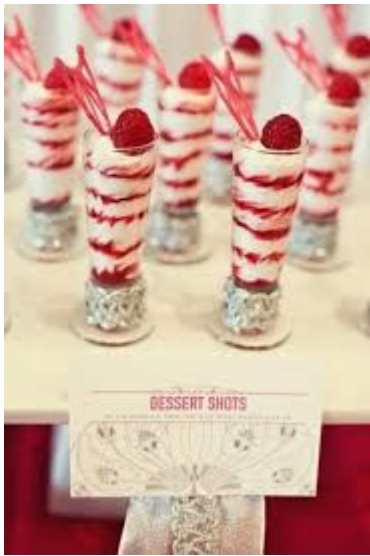
Десерт-шот с ягодами