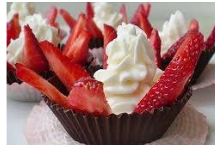
Десерты в корзиночке