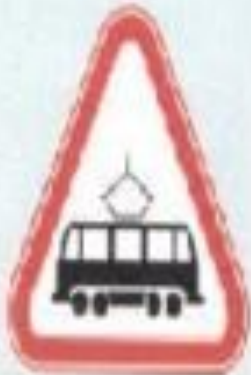
Трамвай жолымен қиылыс