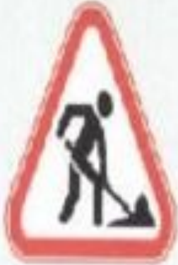
Жол жөндеу жұмыстары