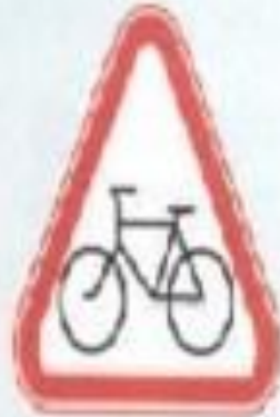
Велосипед жолымен қиылыс