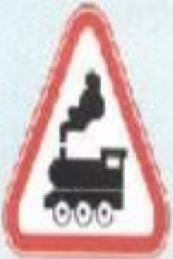
Шлагбаумы жоқ темір жол өтпесі