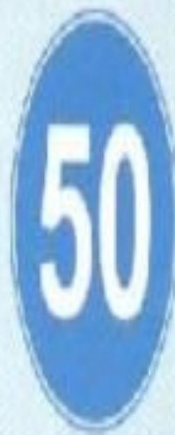
Ең төменгі қозғалысты шектеу