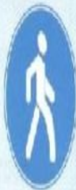
Жаяу жүргінші жолы