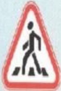
Жаяу жүргінші өтпесі