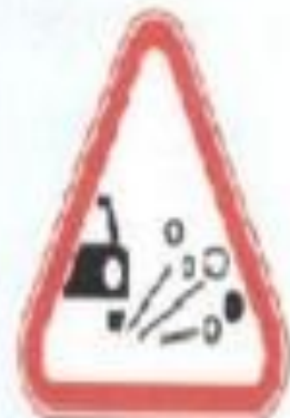
Қиыршық тас шашырау