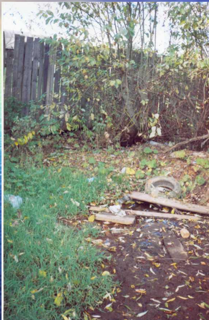
Фото родника №1