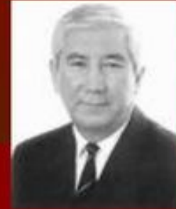
Қазақ ғалымы Мырзатай Жолдасбеков