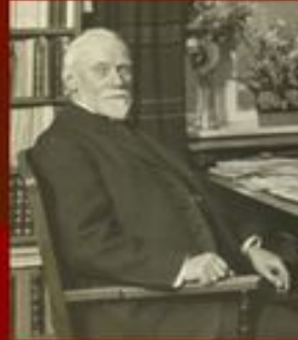
Дания ғалымы В.В.Томсен