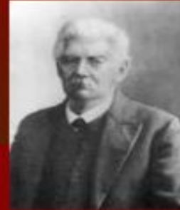
Орыс ғалымы В.В.Радлов