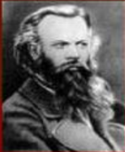
Орыс ғалымы Н.М.Ядринцев