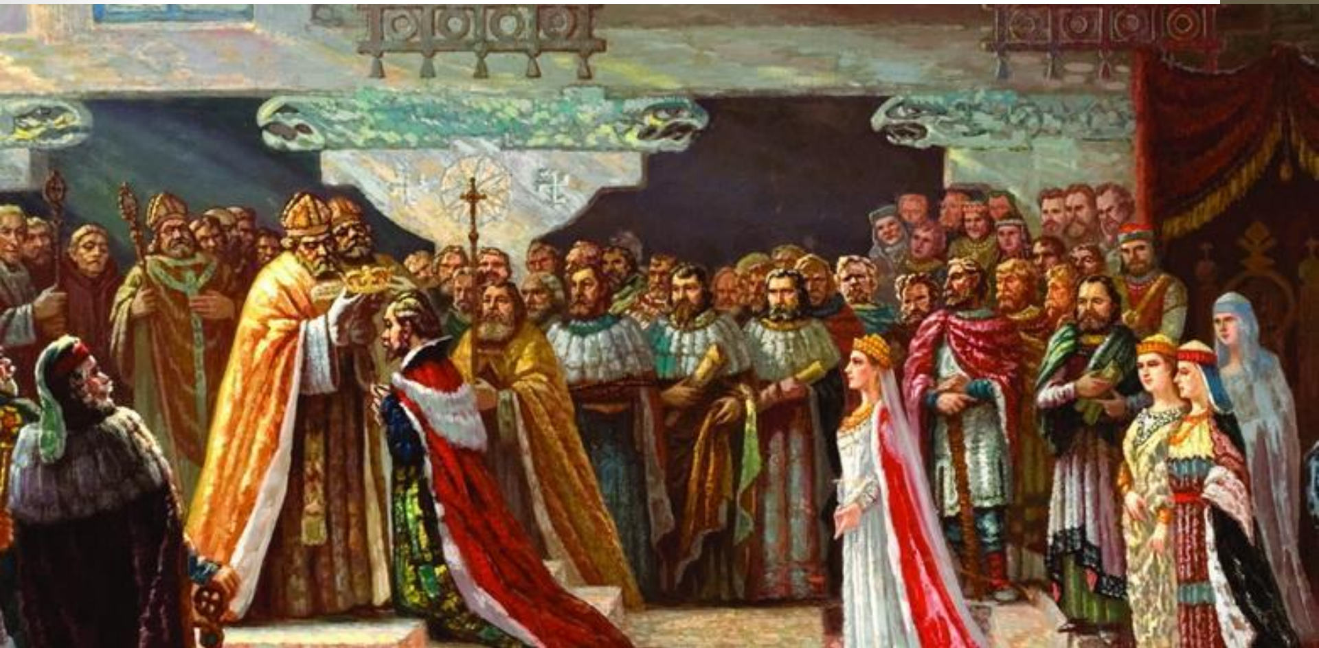
Убит в 1263 г. людьми Тройняты из Жемойтии. Картина Адомаса Варнаса «Коронация Миндовга»