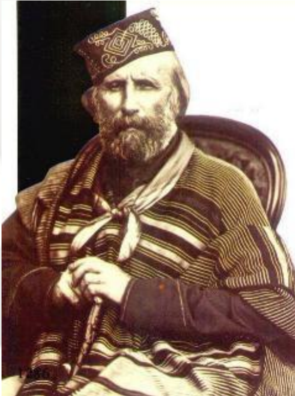
Камилло Бенсо ди Кавур (1810-1861 гг.)