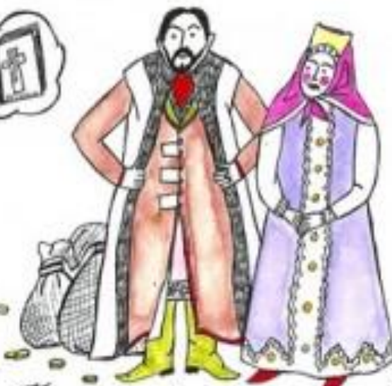
Богатый купец и его жена