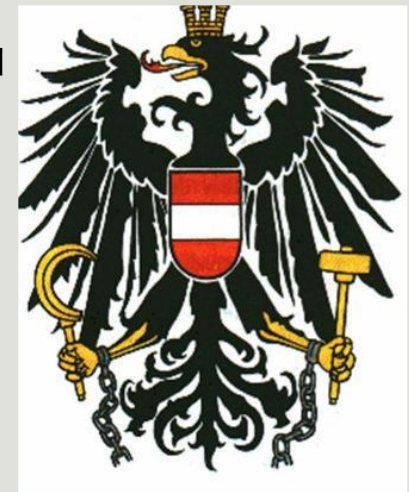
Герб цеха кузнецов