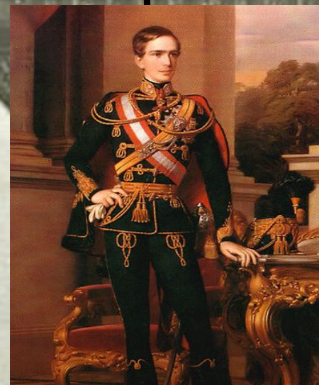
Франц Иосиф I