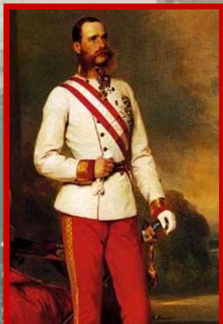
Император Австро- Венгрии Франц Иосиф

Возросла необходимость укрепления целостности государства