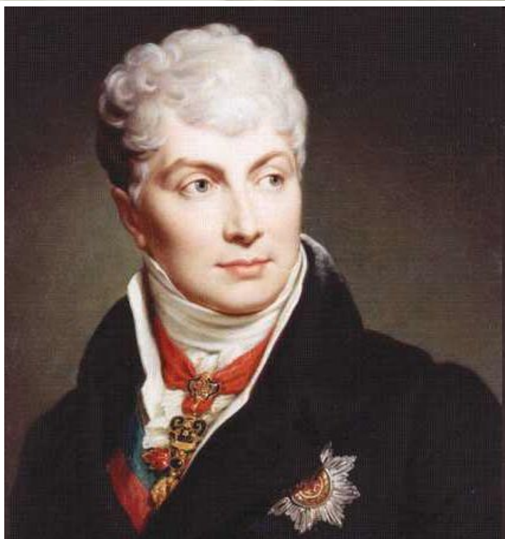
Клемент Венцель Меттерних