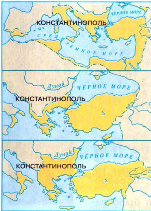
Византийская империя в VI—XI вв.