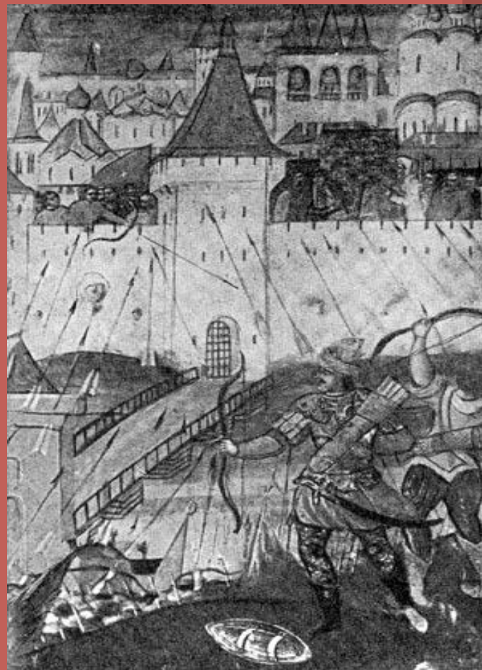
Рис. «Осада шведами Новгорода. 1611 г. (Деталь иконы XVII в.)»

Шведы под предлогом приглашения на российский престол королевича Владислава захватили Новгород. Поляки захватили Смоленск и Москву. В Пскове объявился Лжедмитрий III.