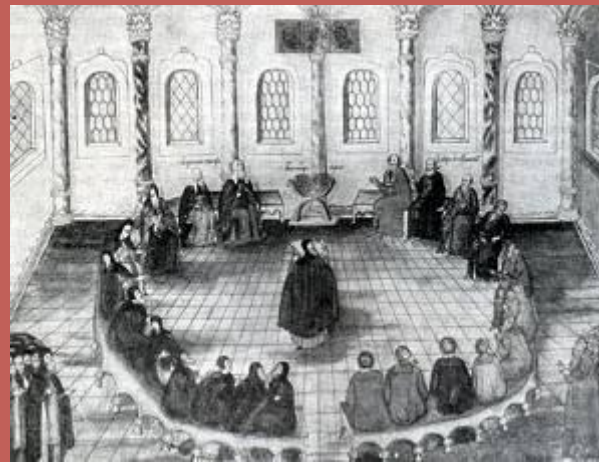
Рис.внизу: А.Д.Кившенко «Первый Романов»

Рис. вверху: «Земский 1613 г.» (миниатюра XVII в.)