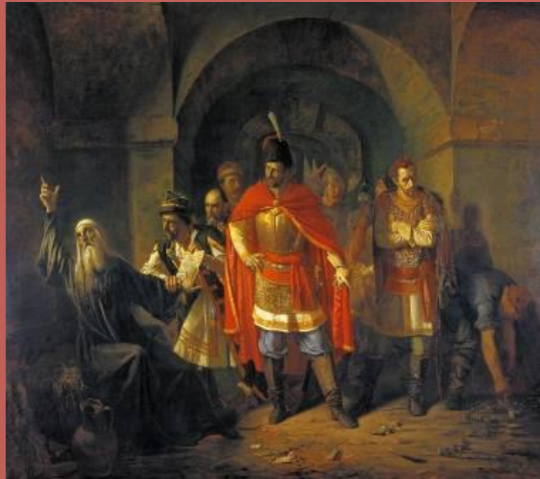
Рис. П. П. Чистяков «Патриарх Гермоген отказывается полякам подписать грамоту»

Патриарх Гермоген – глава Русской православной церкви призвал российский народ к сопротивлению. За это поляки бросили его в темницу кремлёвского Чудова монастыря. Тем временем Лжедмитрий был убит.