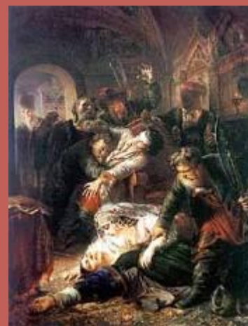
Рис.вверху: «Лжедмитрий I» Гравюра XVII в. Рис.внизу: К.Е.Маковский «Убийство Фёдора Годунова агентами Лжедмитрия»