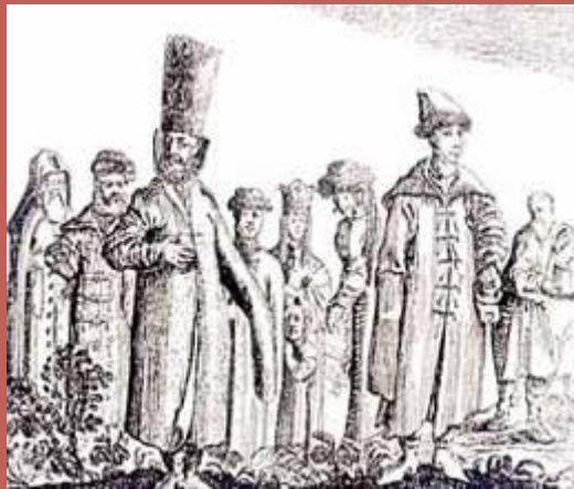
Рис. вверху: Королевич Владислав. (Гравюра XVII в.)