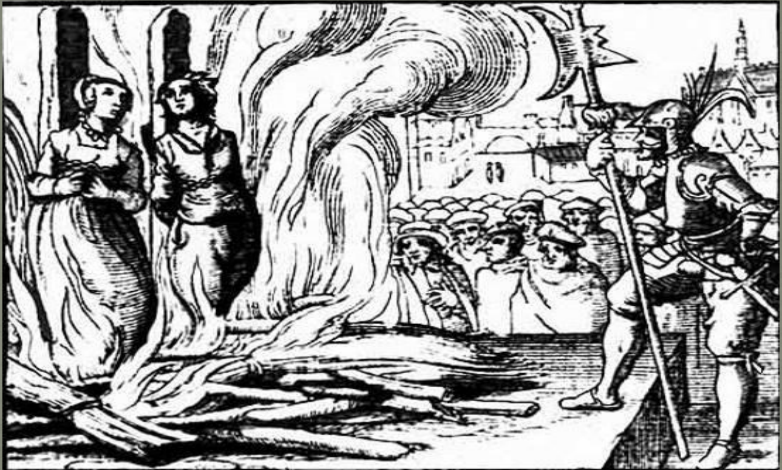
Казнь еретиков в средние века