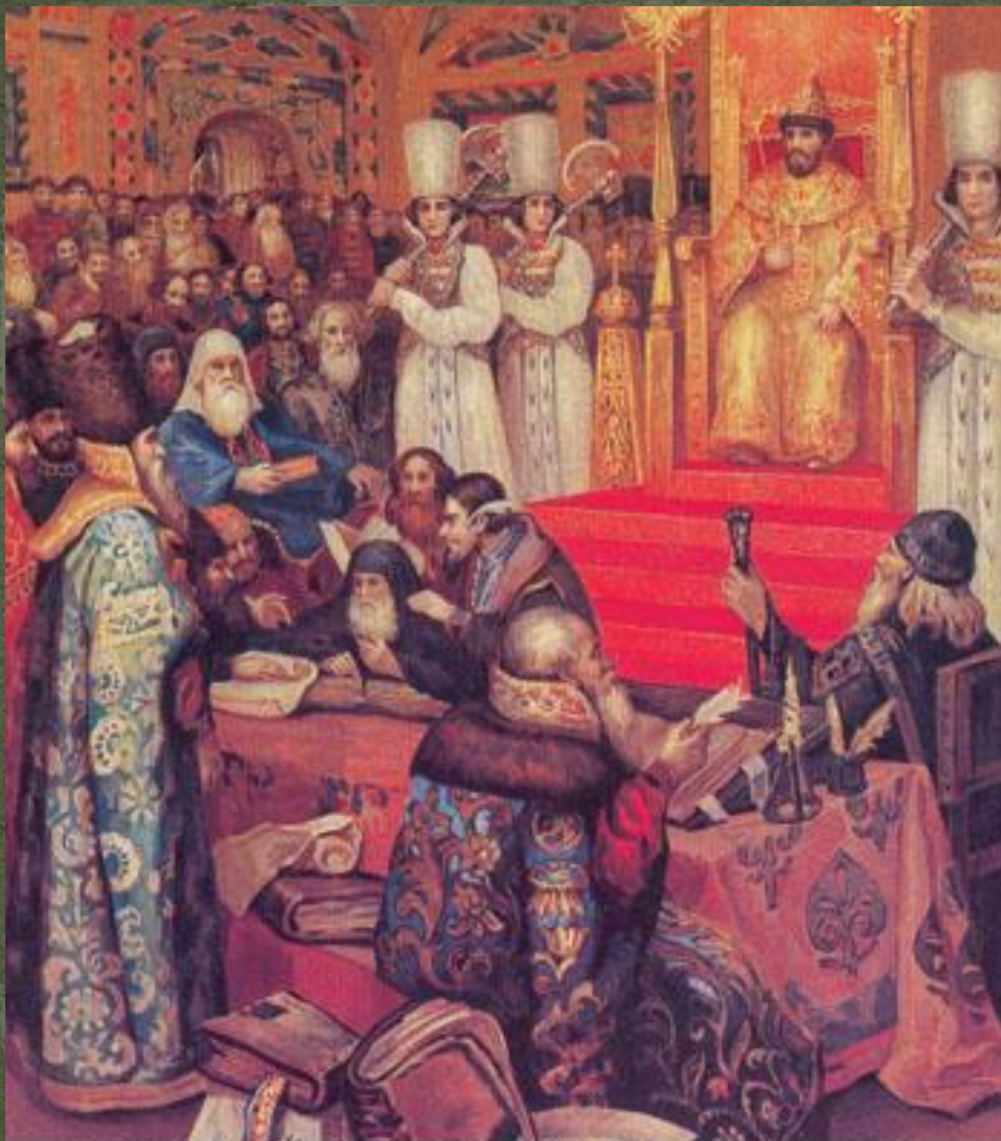
Н.Ф.Некрасов Составление Соборного Уложения при царе Алексее Михайловиче. 1649 г.