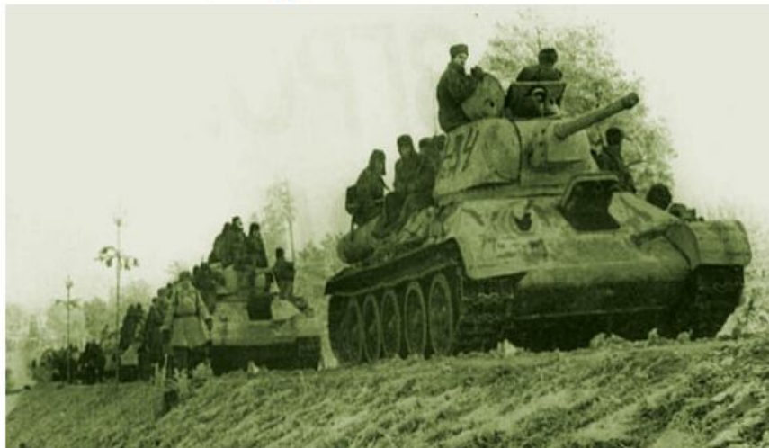
Русские танки Т-34-76 на марше.

Несколько успешнее развивалось наступление правифланговых соединений 27-й армии (337-я и 180-я стрелковые дивизии) и взаимодействующих с ними частей 6-й танковой армии, и в этих условиях командующий фронтом решил перенести всю тяжесть главного удара в полосу 6-й танковой и 27-й армий. С этой целью с 23 часов 27 января в подчинение 6-й танковой армии передавался 47-й стрелковый корпус (167-я, 359-я стрелковые дивизии) из 40-й армии 31 января 27-й армии 1-го Украинского фронта и 4-й гвардейской армии и 5-го гвардейского кавалерийского корпуса 2-го Украинского фронта встретились в районе Ольшаны, замкнув тем самым кольцо окружения.