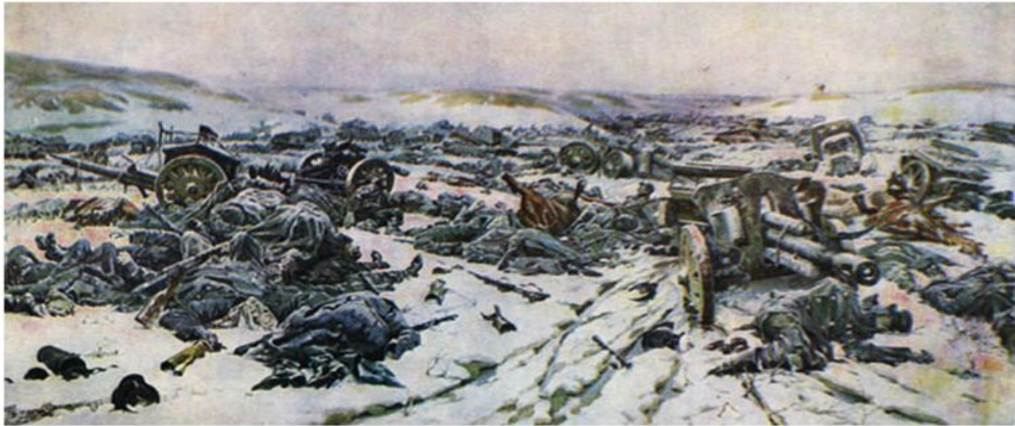
Маскаров Б. Э.