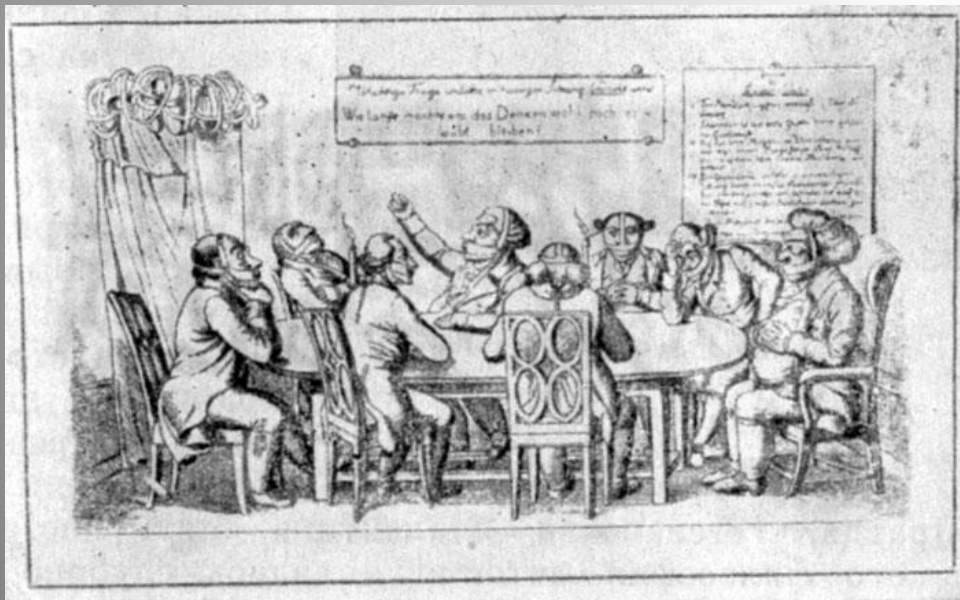
Карикатура на Карлсбадские постановления. 1820 г.