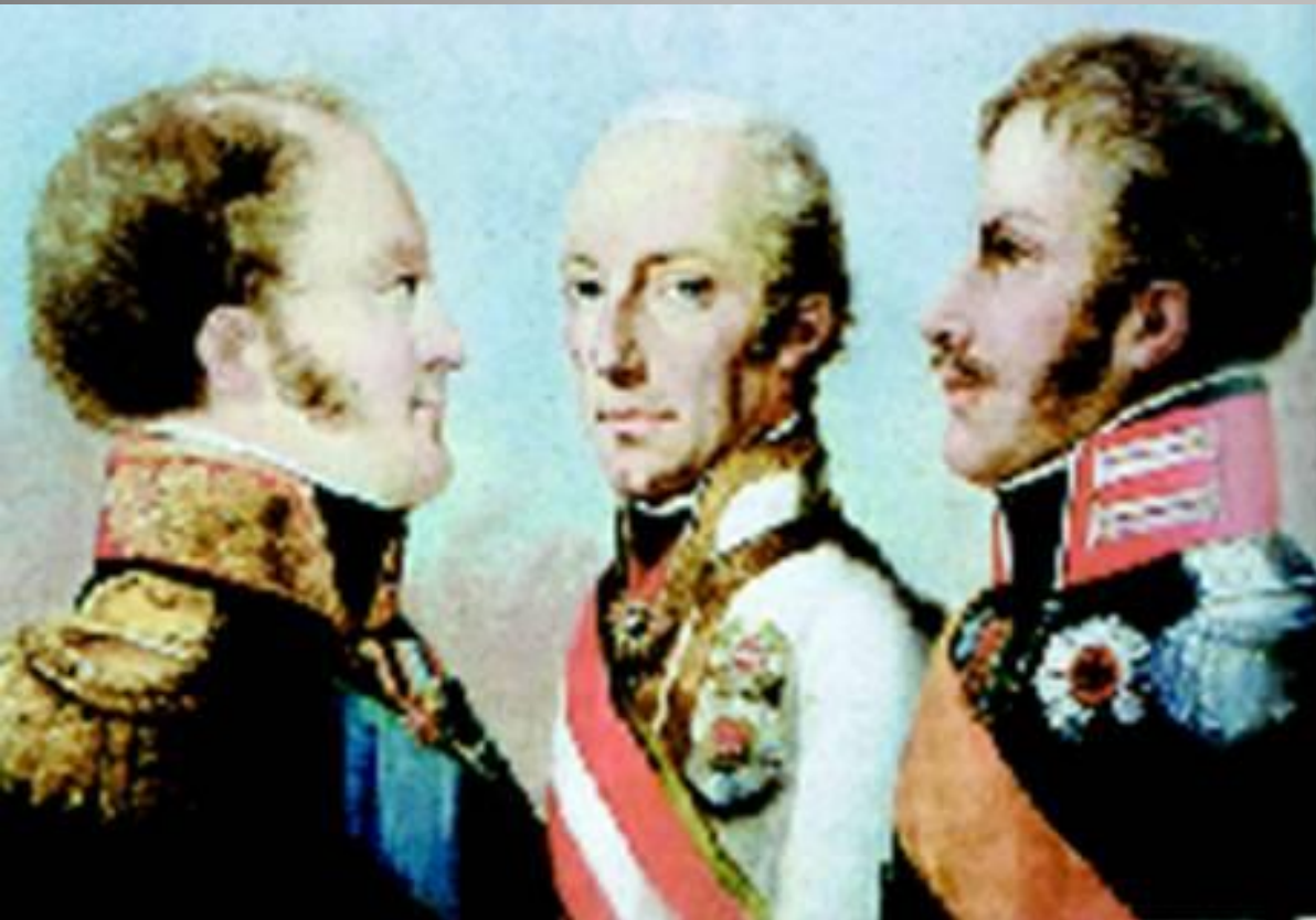
Правители государств Священного союза

► В уставшей от войн Европе преобладали стремления к спокойствию и порядку. Это открывало возможности компромисса между старой аристократией и новой буржуазией. После победы над Наполеоном во Франции была учреждена конституционная монархия.