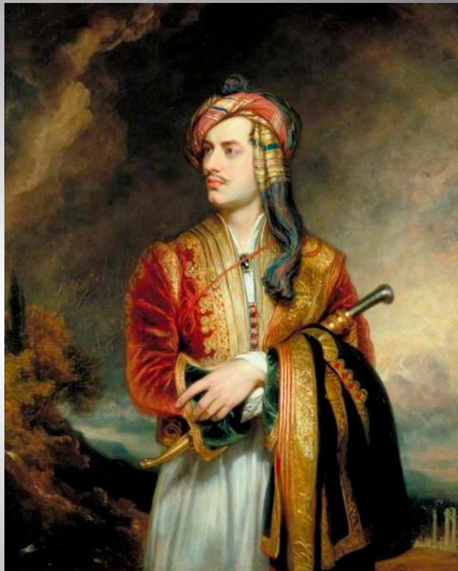
Дж. Байрон в албанском костюме. Художник Т. Филлипс

❖ Из многих стран в Грецию прибывали добровольцы, чтобы принять участие в борьбе за свободу. Среди них был английский поэт Джордж Байрон , погибший в этой борьбе. Поначалу Священный союз осудил мятеж греческих подданных против своего повелителя – султана, выступая как защитник интересов и безопасности монархов, а не народа.