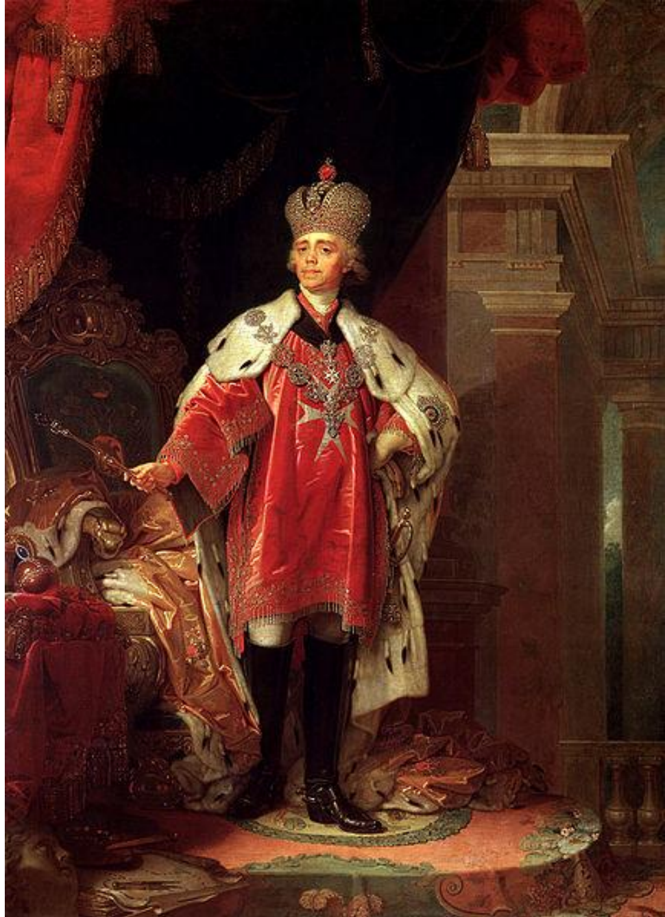
Боровиковский В. Л. Портрет Павла I. около 1800 г

Научил сына совмещать душевную любовь к человечеству с практической заботой о ближнем.