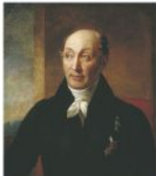
Михаил Михайлович Сперанский

Вернуть авторитет, утраченный после Тильзита, Александр I решил с помощью нового витка реформаторской деятельности. С охлаждением царя к членам Негласного комитета возникла потребность в новых лицах, которые, однако, должны были продолжить прежнее направление реформ.