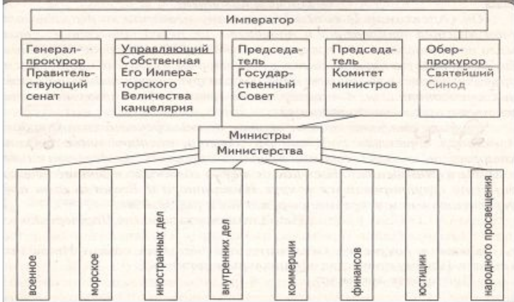
С Схема 3. СИСТЕМА ЦЕНТРАЛЬНОГО УПРАВЛЕНИЯ РОССИЙСКОЙ ИМПЕРИИ В ПЕРВОЙ ПОЛОВИНЕ XIX в.