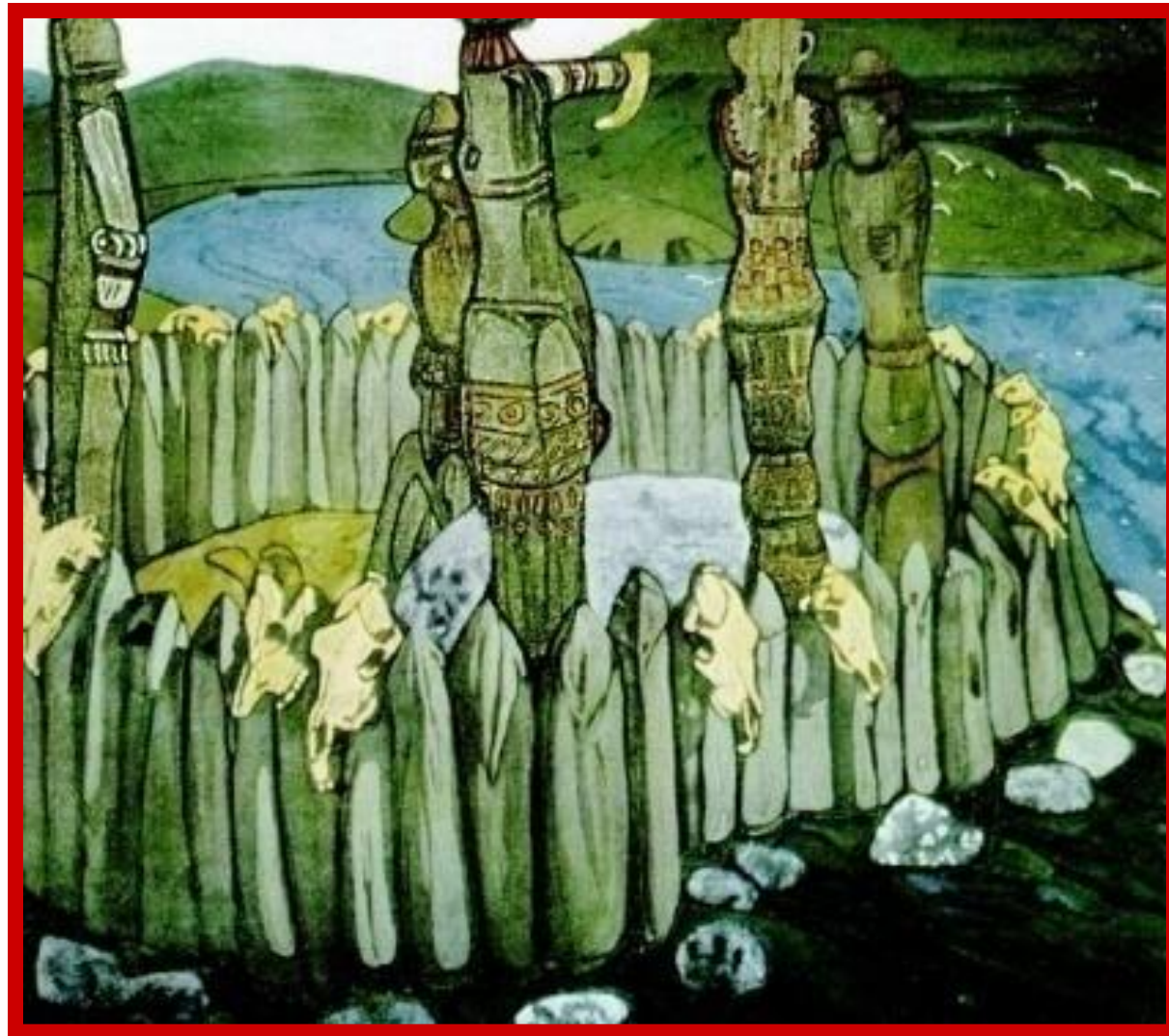
Н. Рерих. Языческое святилище