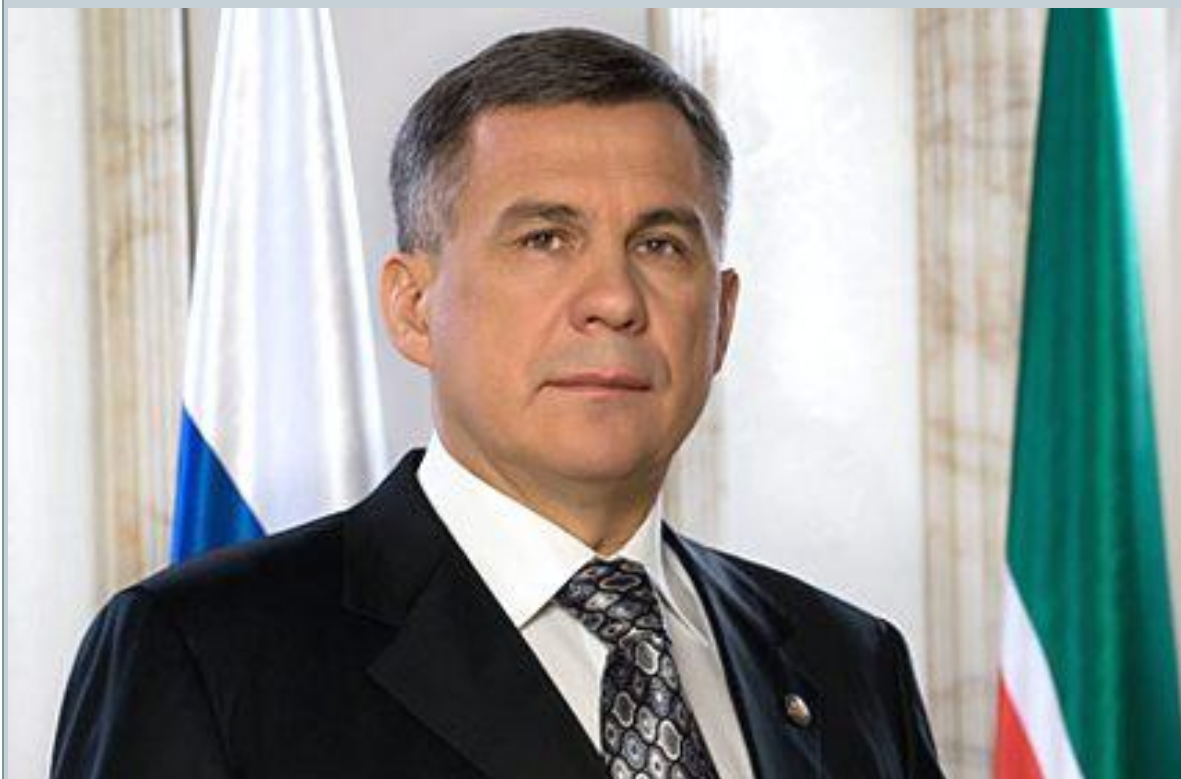
Рустам Нургалиевич Минниханов