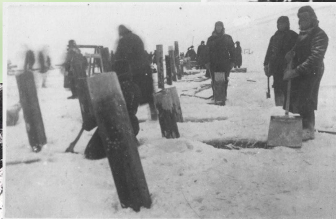
ПЕРЕКОС СВАИ В РЕЗУЛЬТАТЕ ПОДВИЖКИ ЛЬДА.