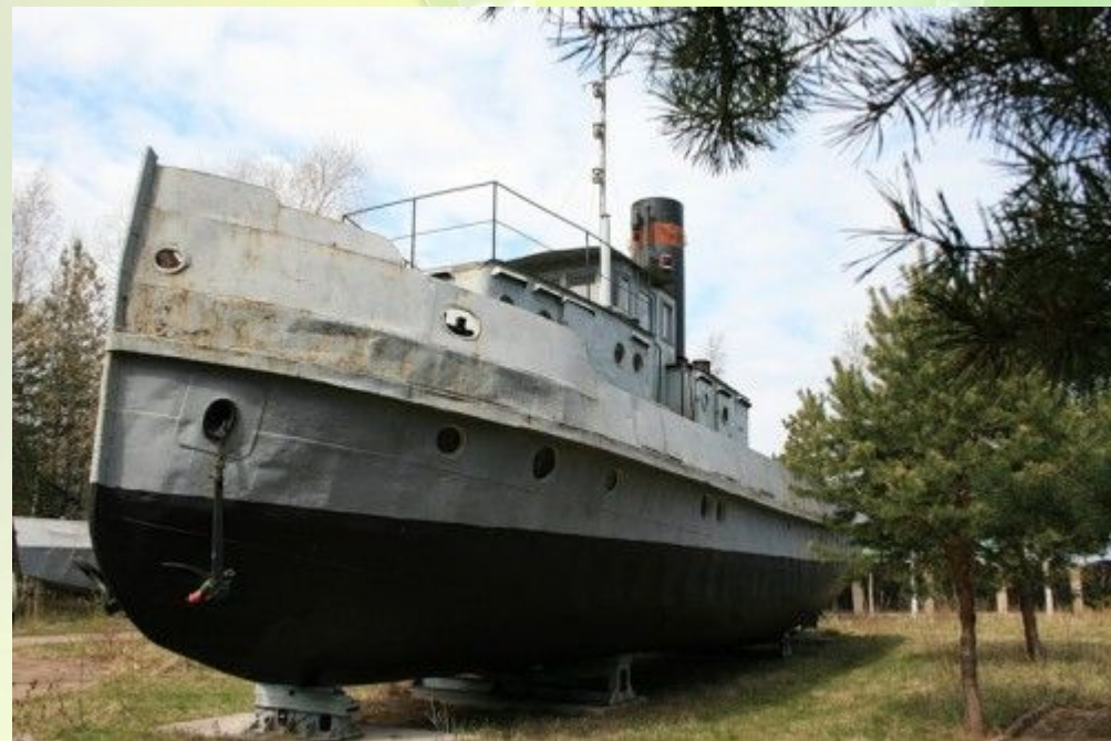
Сторожевой катер МО-215 (точнее то, что от него осталось).

Построен в Ленинграде. 16 августа 1941 г. вступил в строй. С боями прошел до границы с Фашистской Германией. Участвовал в боевых операциях на ладожском озере и Финском заливе. Пройшел около 5 тысяч миль. Совершил 24 боевых похода. В годы войны входил в состав Ладожской военной флотилии.