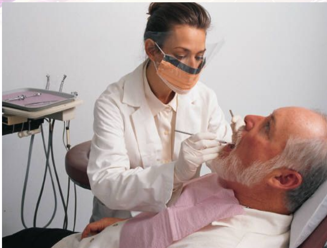
Стоматолог – зубной врач