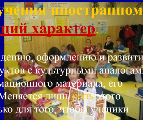
«В гостях у сказки», 2010г.