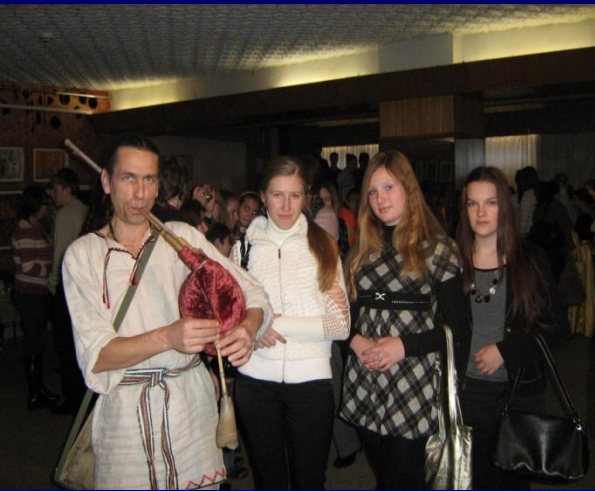
На Международный фестиваль песни и танца народов мира «Возьмемся за руки, друзья», г. Воронеж 2008г.

Образование детей в эвристической технологии - своеобразный аналог, прообраз "взрослой" профессиональной деятельности и поэтому включает в себя основные типы деятельности человека и многообразие их результатов. Мои ученики, создавая индивидуальные образовательные продукты познания объектов, с удовольствием моделируют на уровне своего развития и образования аналогичные процессы «большой» науки или иной сферы деятельности взрослых. (примером является работа учеников 10 класса «Английский язык и образование специфического компьютерного сленга.») Такой процесс является переходом к знакомству и сопоставительному усвоению учениками культурного многообразия общечеловеческих продуктов труда, поскольку дети осваивают "настоящие" способы деятельности, которые имеют не столько учебно-тренировочную, сколько реально действенную роль в их жизни.