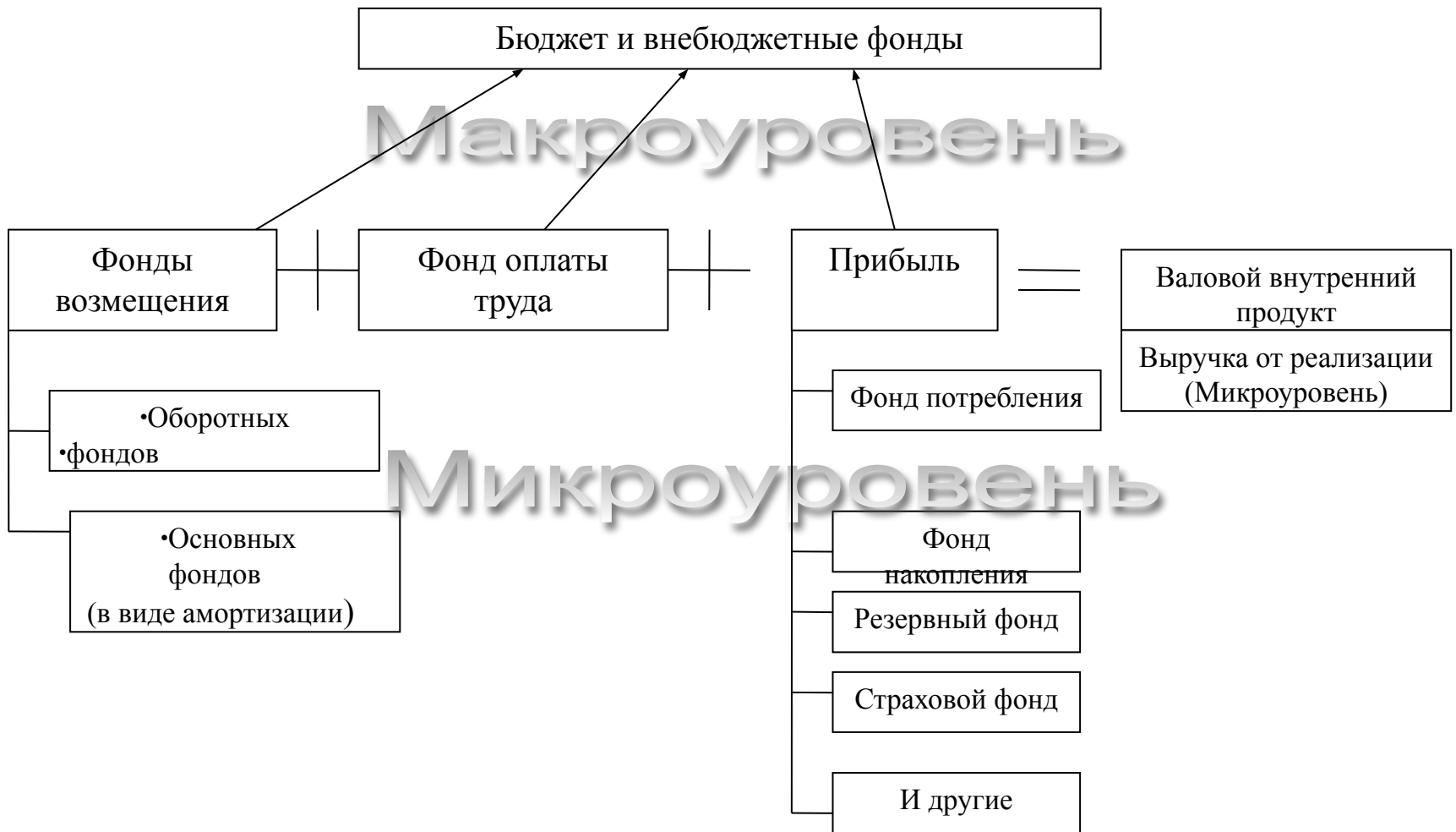
Рис.2. Распределительная сущность финансов