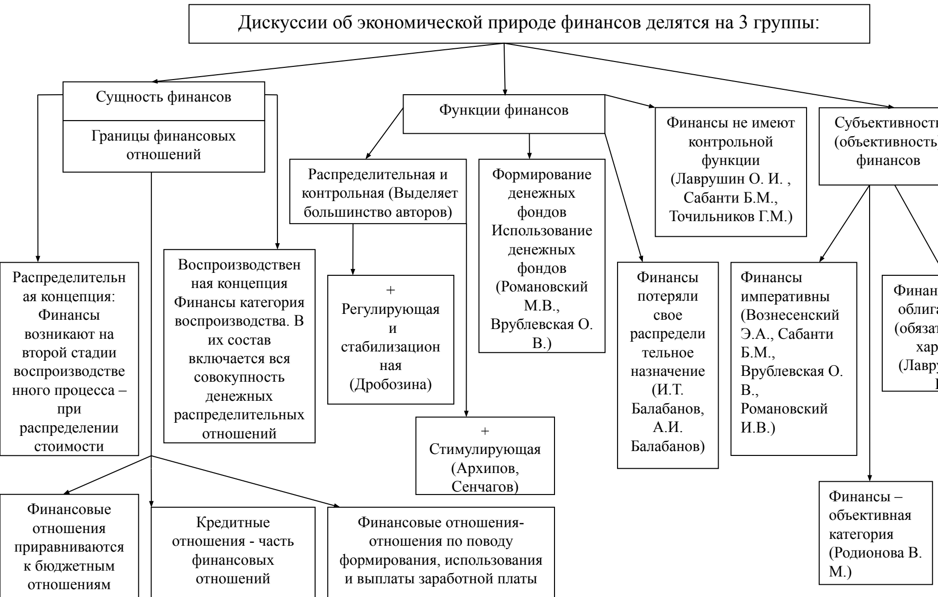
Рис. 1. Дискуссии об экономической природе финансов