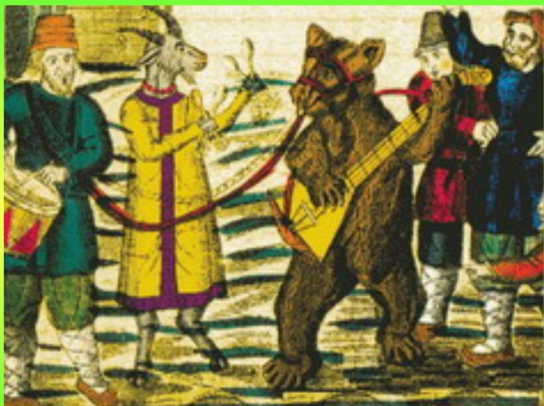
Старинная лубочная картинка