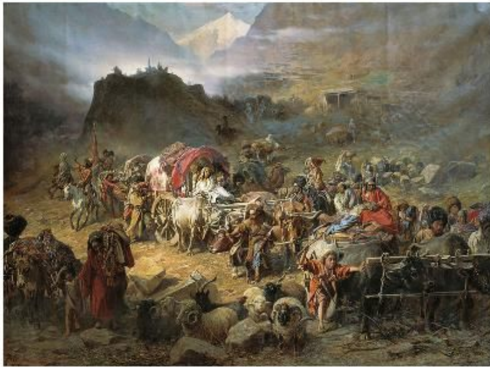
Залишення горцями власного аула, при наближенні російських військ, Петро Грузинський, 1842 р.