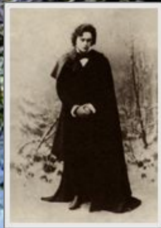
Ленский - Собинов

Почему в сцене описания смерти Ленского перемежаются романтический и реалистический стиль повествования?