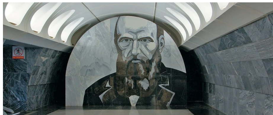
Художник И. Николаев