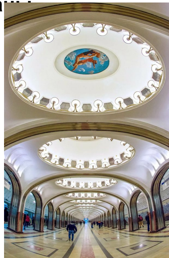
Художник А. А. Дейнека