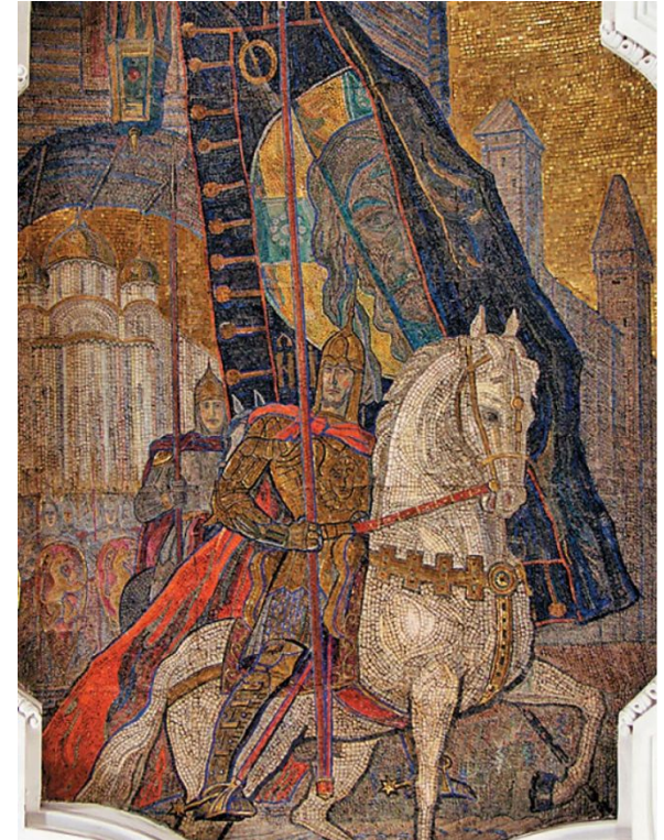
Художник П.Д. Корин