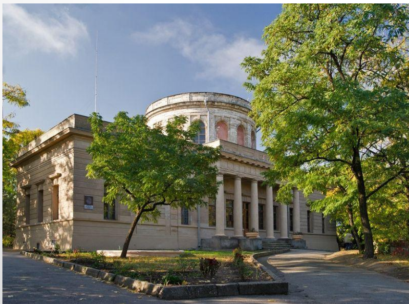
Обсерваторія, 1827 рік, Миколаїв