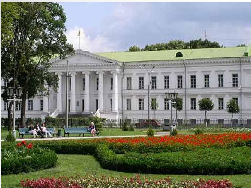
Будинок міської адміністрації Полтави