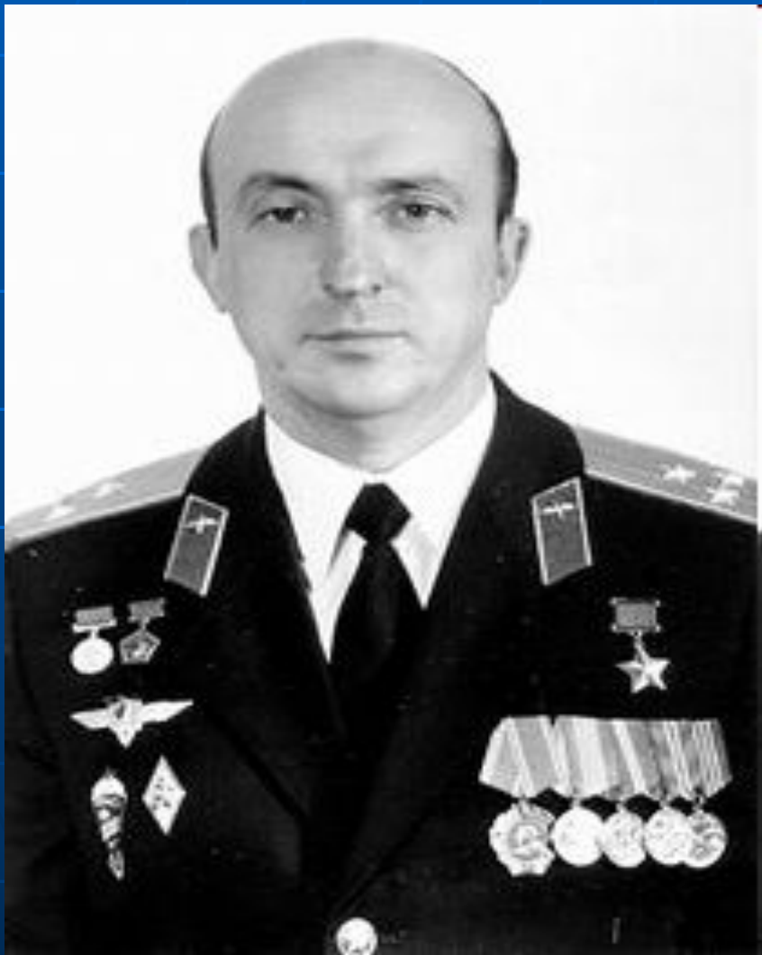
Васютин Владимир Владимирович, Лётчик-космонавт СССР, генерал- лейтенант, Герой Советского Союза.