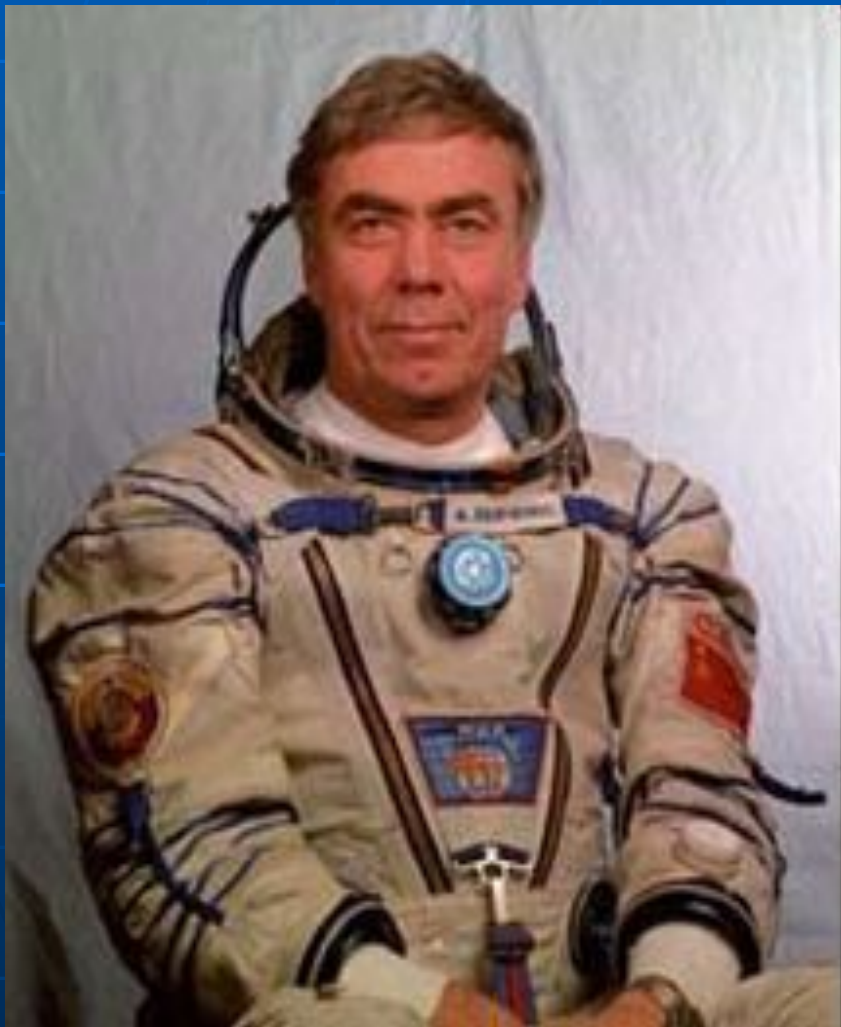
Левченко Анатолий Семенович (Харьковская обл.), советский космонавт, Герой Советского Союза