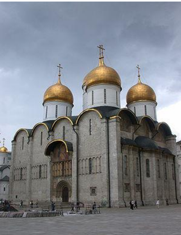
Успенский собор 1326—1327 годов был первым каменным храмом Москвы