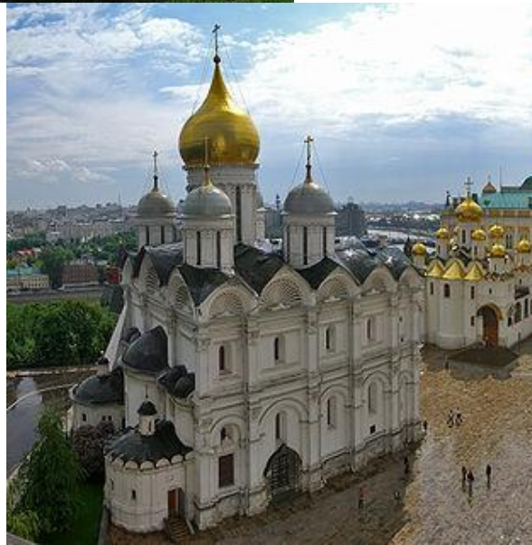
Архангельский собор. Расположен на Соборной площади Московского Кремля.