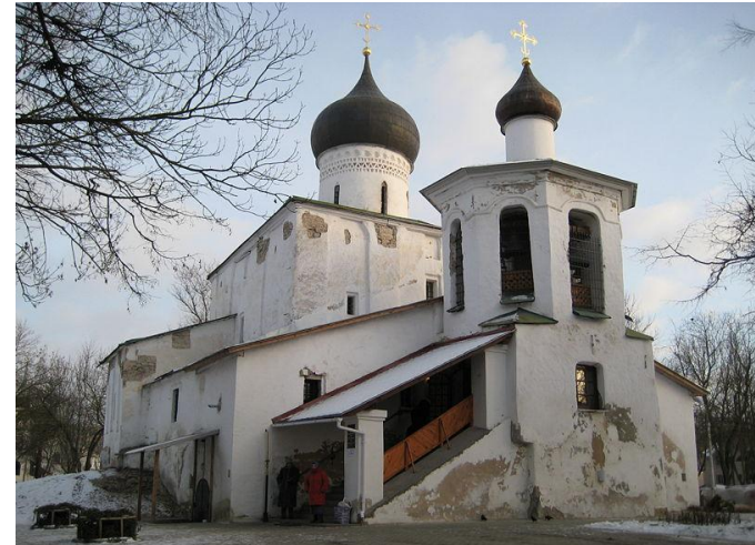
Православный храм, памятник архитектуры XV—XVI века, расположенный в Пскове.