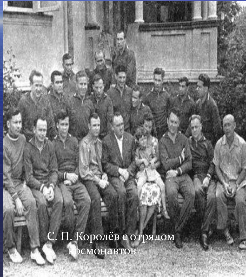
С. П. Королёв с отрядом космонавтов

Вслед за первым полётом Ю. А. Гагарина 6 августа 1961 года Германом Титовым на корабле «Восток-2» был совершён второй космический полёт, который длился одни сутки. Опять — скрупулёзный анализ влияния условий полёта на функционирование организма. Затем совместный полёт космических кораблей «Восток-3» и «Восток-4», пилотируемых космонавтами А. Г. Николаевым и П. Р. Поповичем, с 11 по 12 августа 1962 года; между космонавтами была установлена прямая радиосвязь. На следующий год — совместный полёт космонавтов В. Ф. Быковского и В. В. Терешковой на космических кораблях «Восток-5» и «Восток-6» с 14 по 16 июня 1963 года — изучается возможность полёта в космос