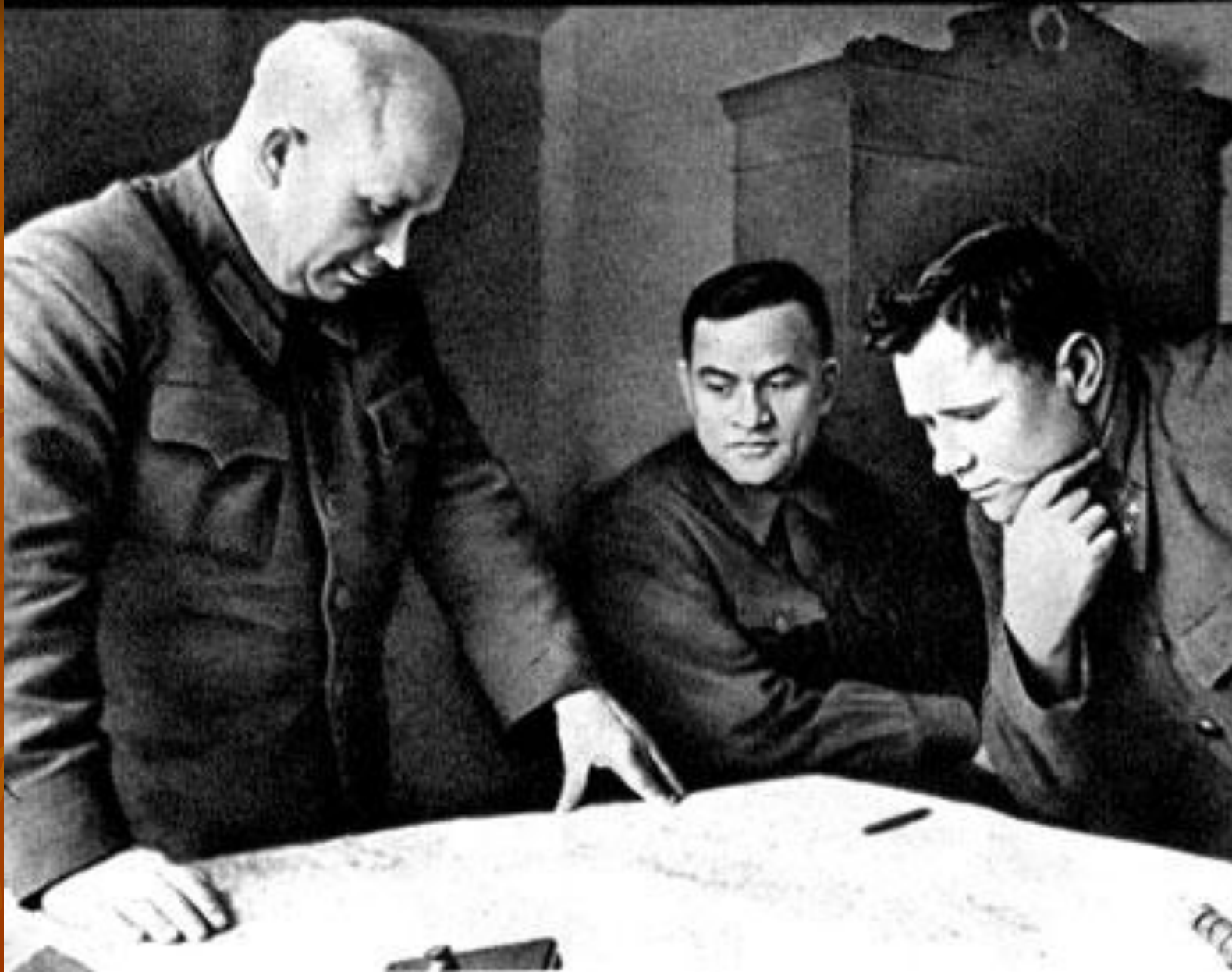
Члены Военного совета Сталинградского фронта (слева) член Политбюро ЦК ВКП(б), секретарь КП(б) Украины Н.С.Хрущев.