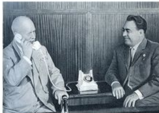
Н. С. Хрущёв и Л. И. Брежнев разговаривают по телефону с космонавтами

Л.И. Брежнев принимал активное участие в космической программе. Он выбирал место для строительства космодрома «Байконур» и лично давал указания Королёву, как ему вести работы над запуском второго спутника