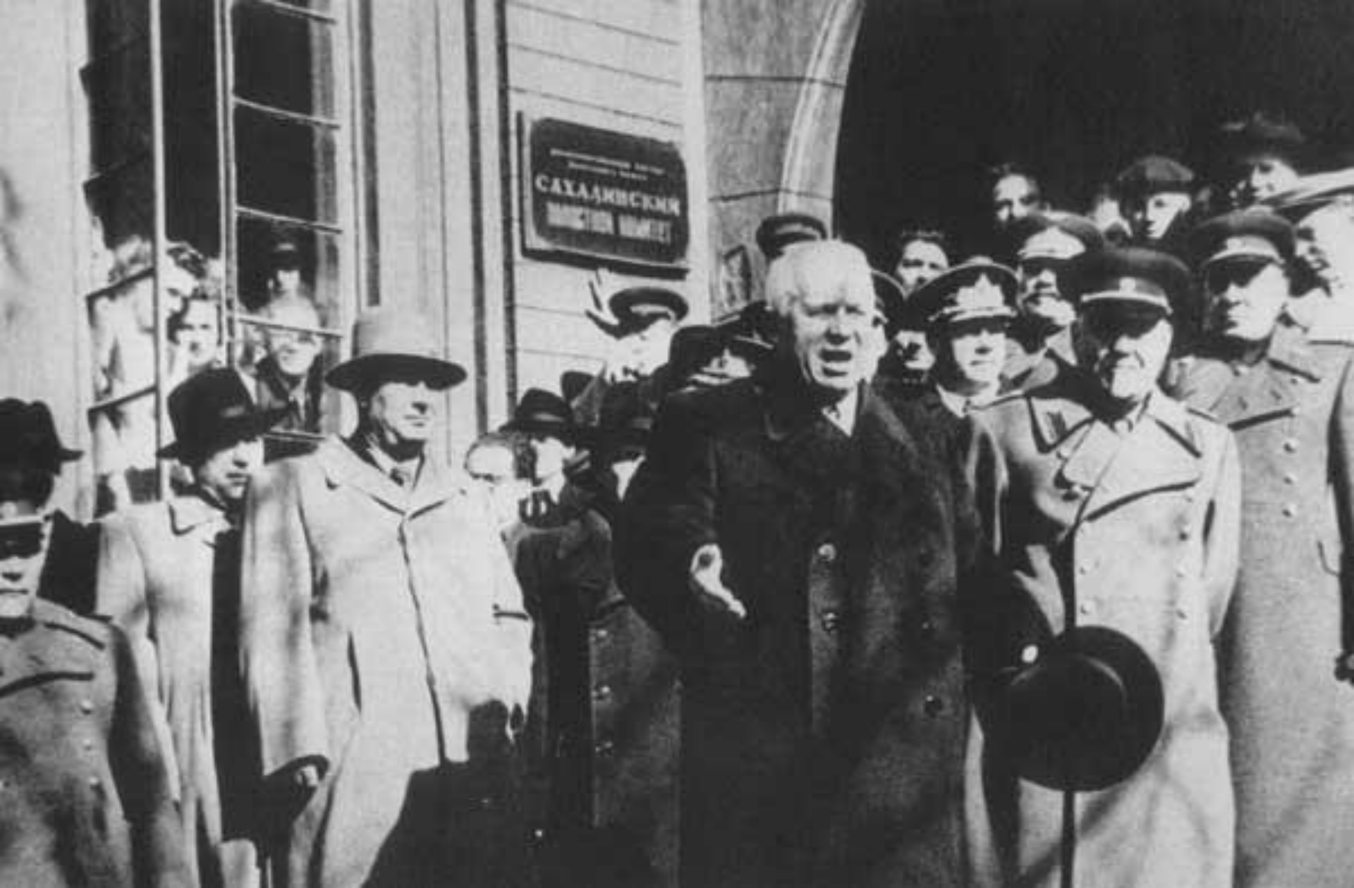
Выступление Н.С.Хрущева в г Южно-Сахалинске 1954 г.