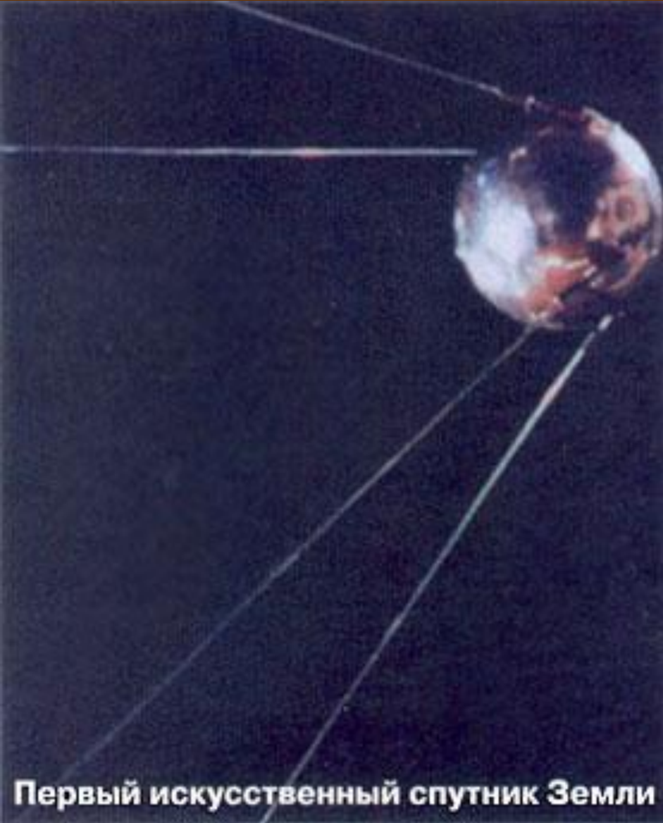
Первый искусственный спутник Земли