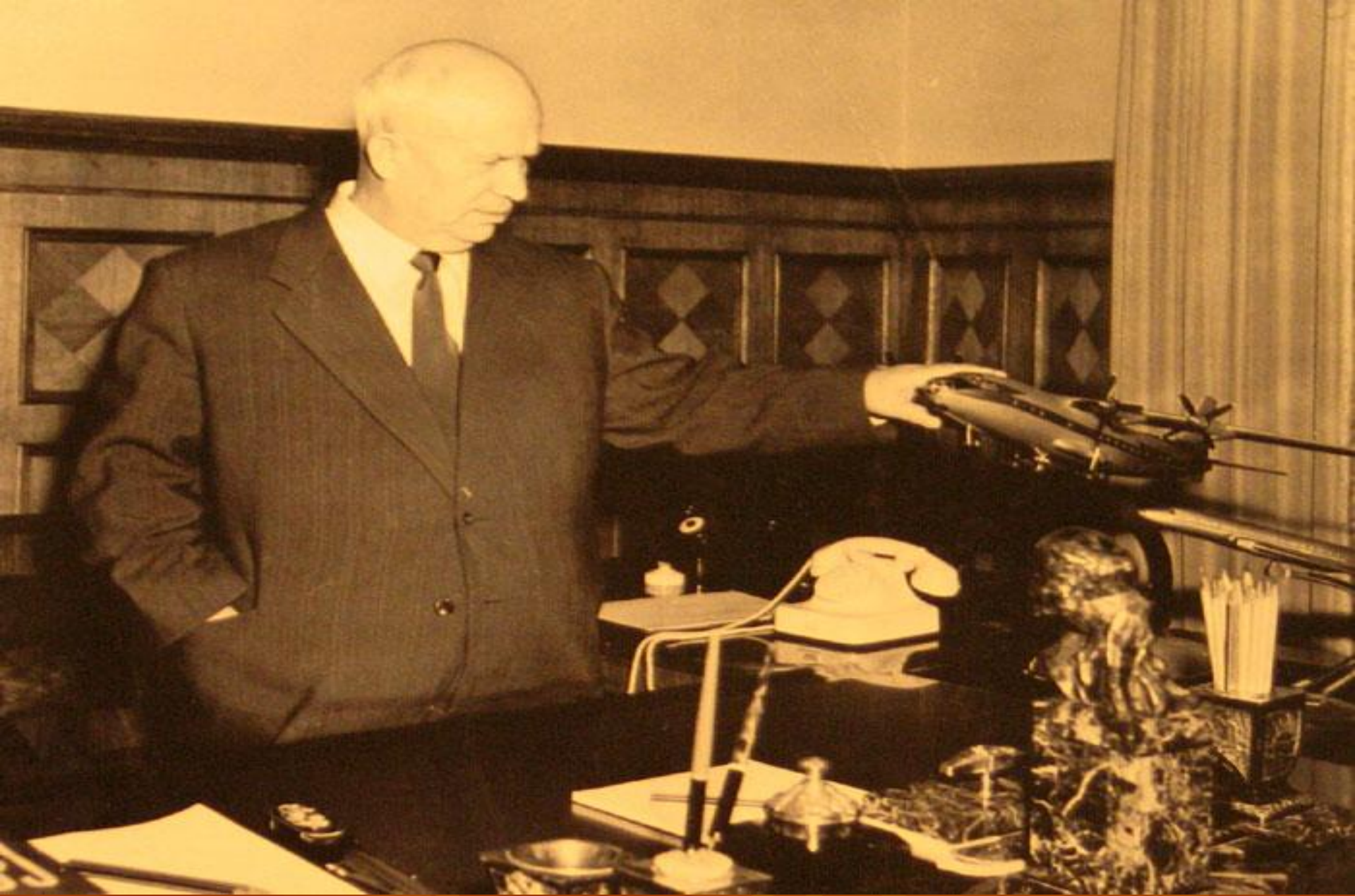
Н.С.Хрущёв в своём рабочем кабинете в Кремле 1957 г.