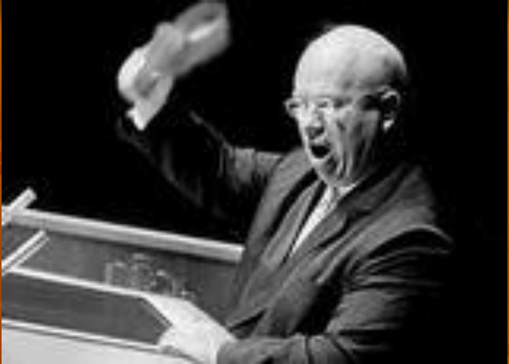
Выступление Никиты Сергеевича Хрущёва на Заседание Ассамблеи ООН .