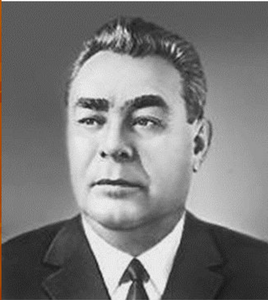
ЛЕОНИД ИЛЬИЧ БРЕЖНЕВ (1906-1982)