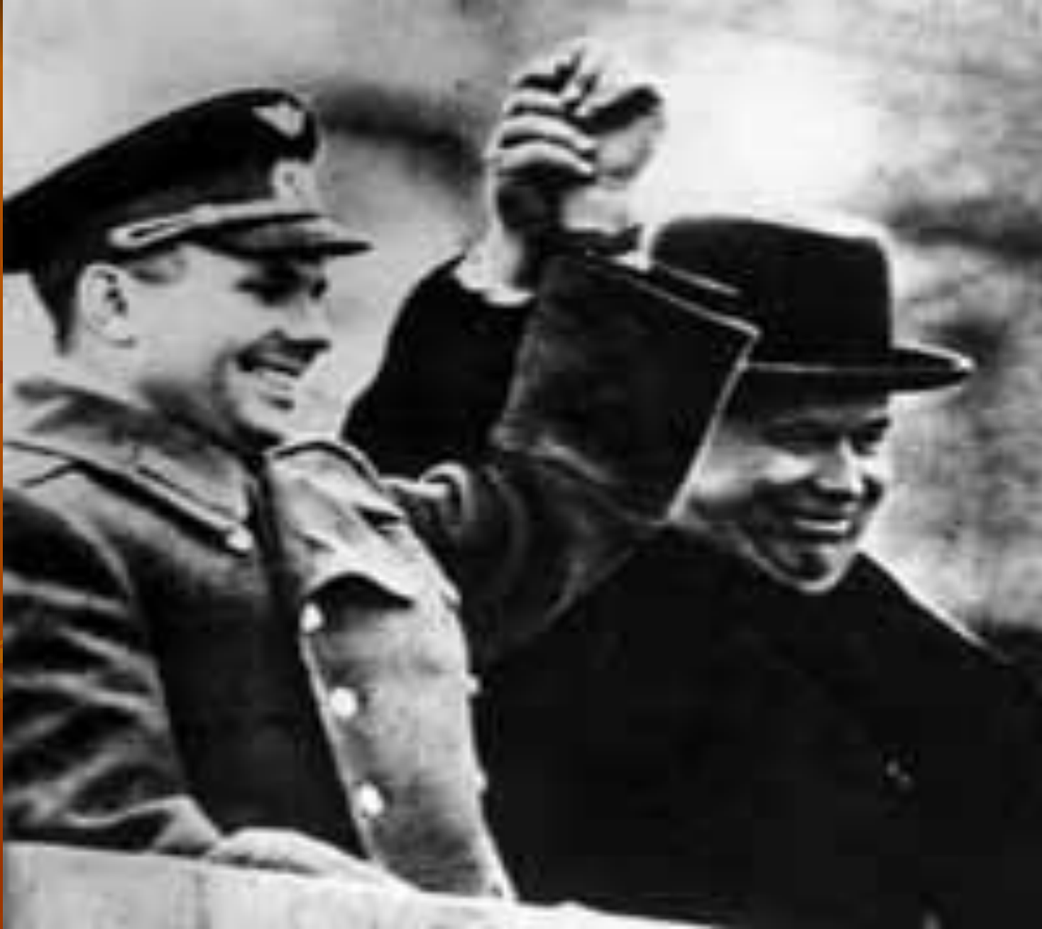
Н.С. Хрущёв и Юрий Алексеевич Гагарин(1961г.).