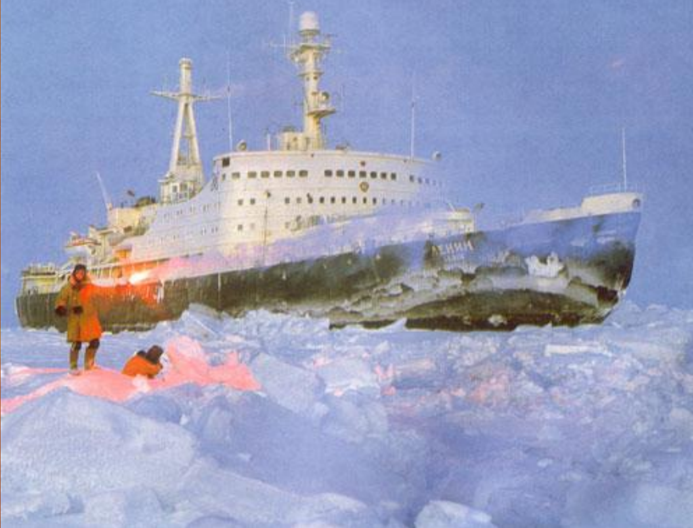
-1957г.-Первый Атомный ледокол «Ленин» .