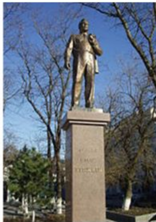
Памятник Брежневу в Новороссийске