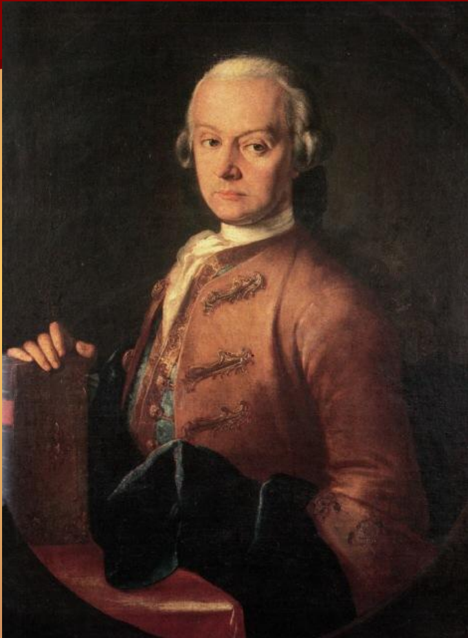
Леопольд Моцарт (отец)

Моцарт родился в небольшом австрийском городе Зальцбурге. При крещении на второй день от роду ему было присвоено длинное имя. Однако в народе его именуют сокращенно - Вольфганг Амадей Моцарт. Его отец являлся известным музыкантом. Именно он обучил маленького композитора игре на пианино, органе и скрипке.