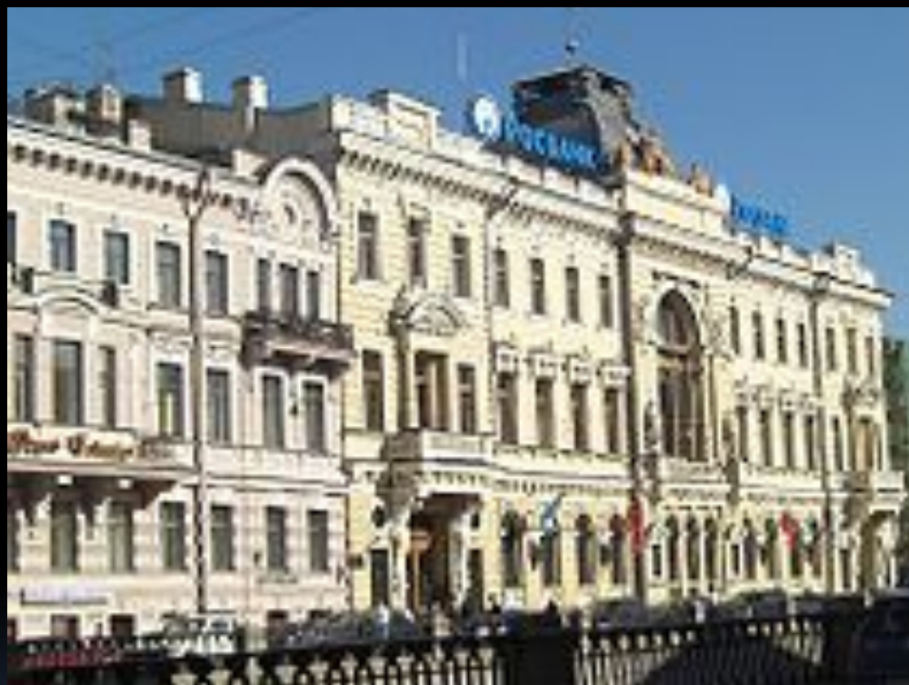
Здание Санкт-Петербургского общества взаимного кредита