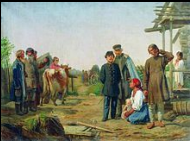
А. И. Корзухин. Сбор недоимок (Уводят последнюю корову). Картина 1868 г.