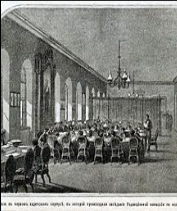
Заседание Редакционной комиссии по освобождению крестьян