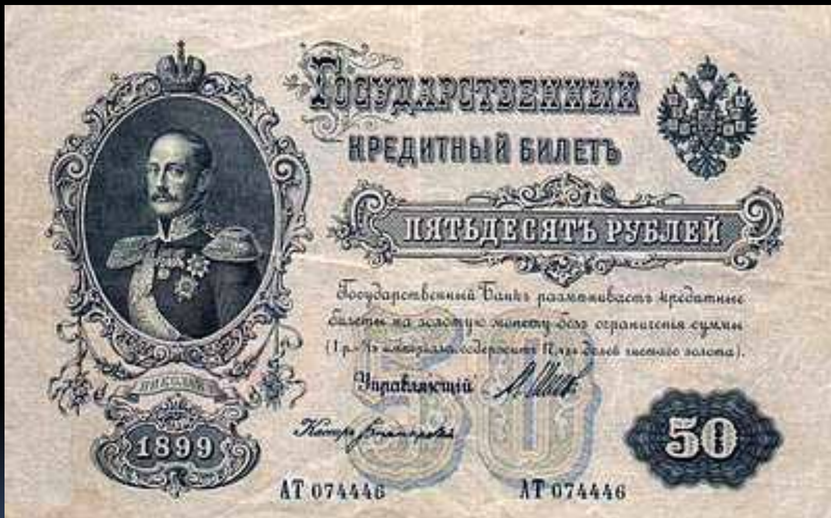
Купюра 50 рублей 1899 года