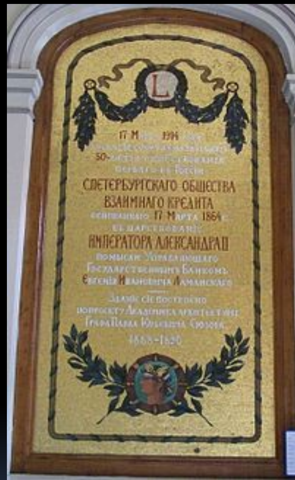
Памятная доска в здании Санкт-Петербургского общества взаимного кредита