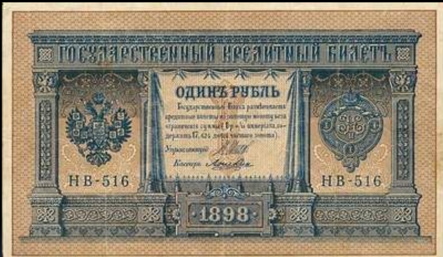
Купюра 1 рубль образца 1898 года выпуска