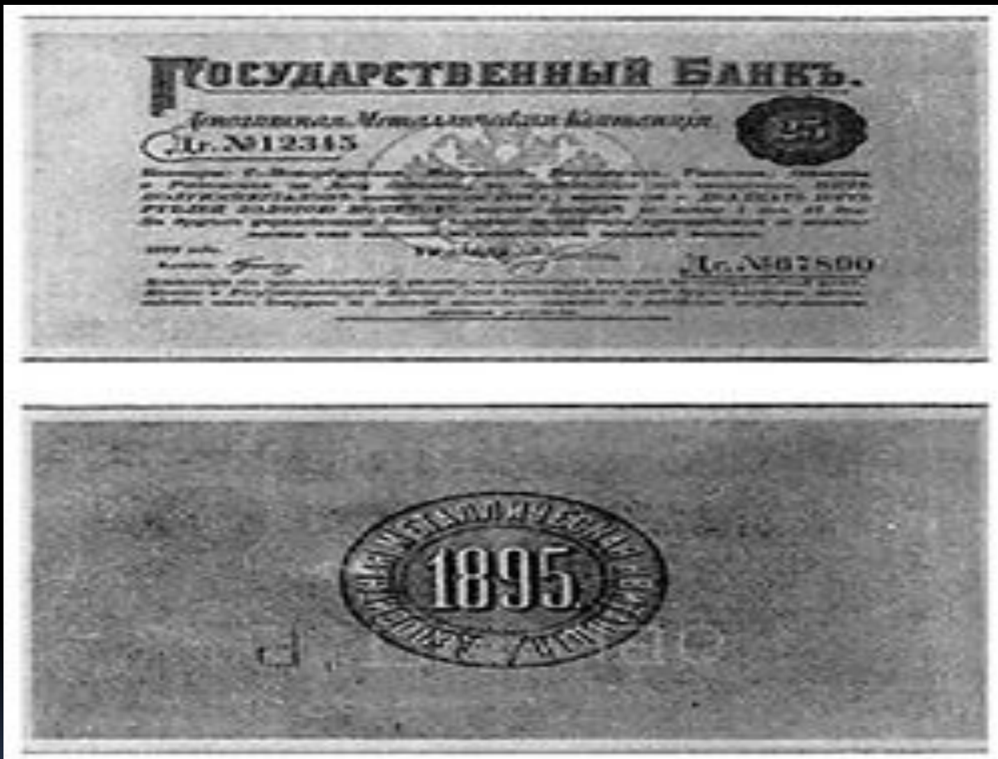
Депозитная металлическая квитанция достоинством 25 руб. образца 1895 г.