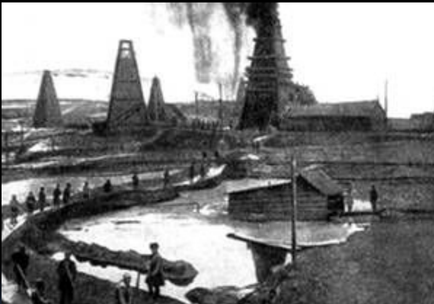
Бакинские нефтяные промыслы. Конец XIX в.