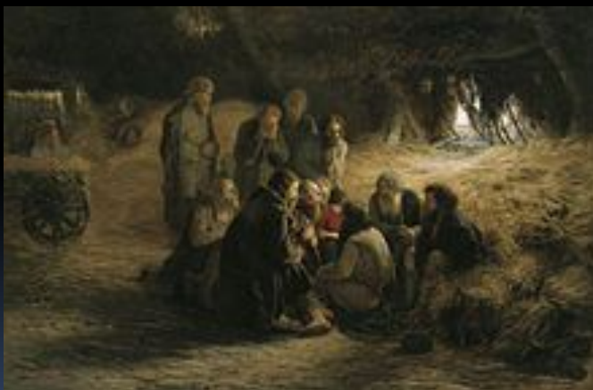
Григорий Мясоедов. Чтение положения 19 февраля 1861 года