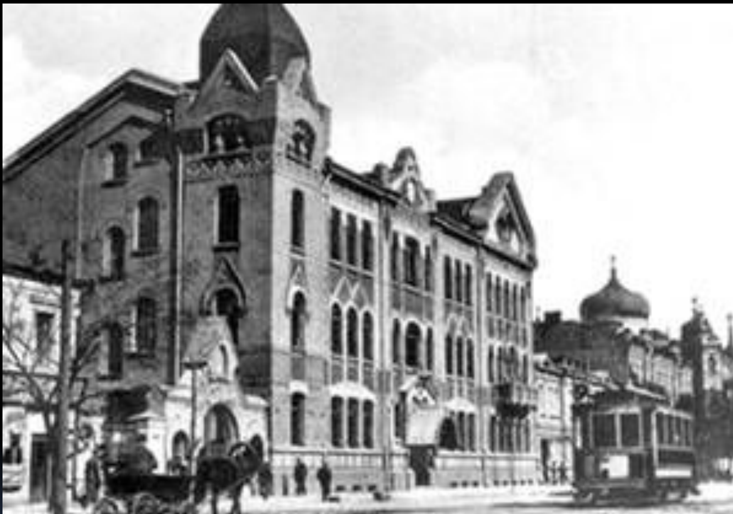
Крестьянский банк. Киев