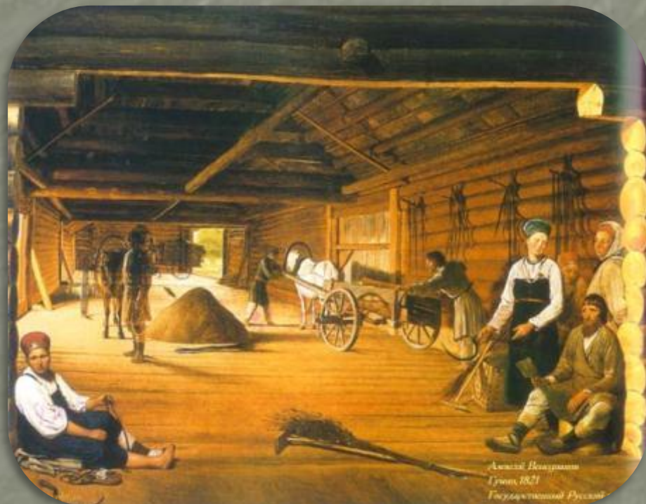
А. Венецианов. Гумно.