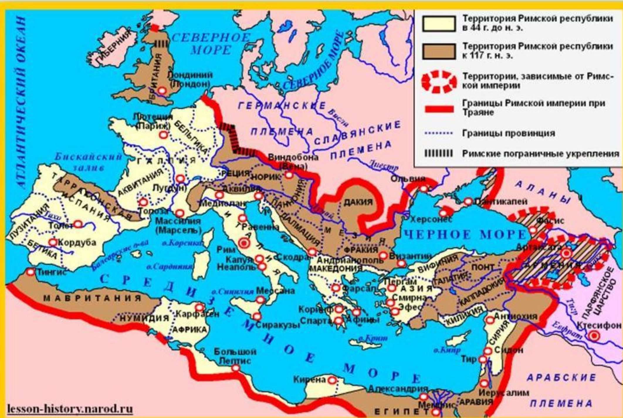
Римская империя ко 2 веку н. э.