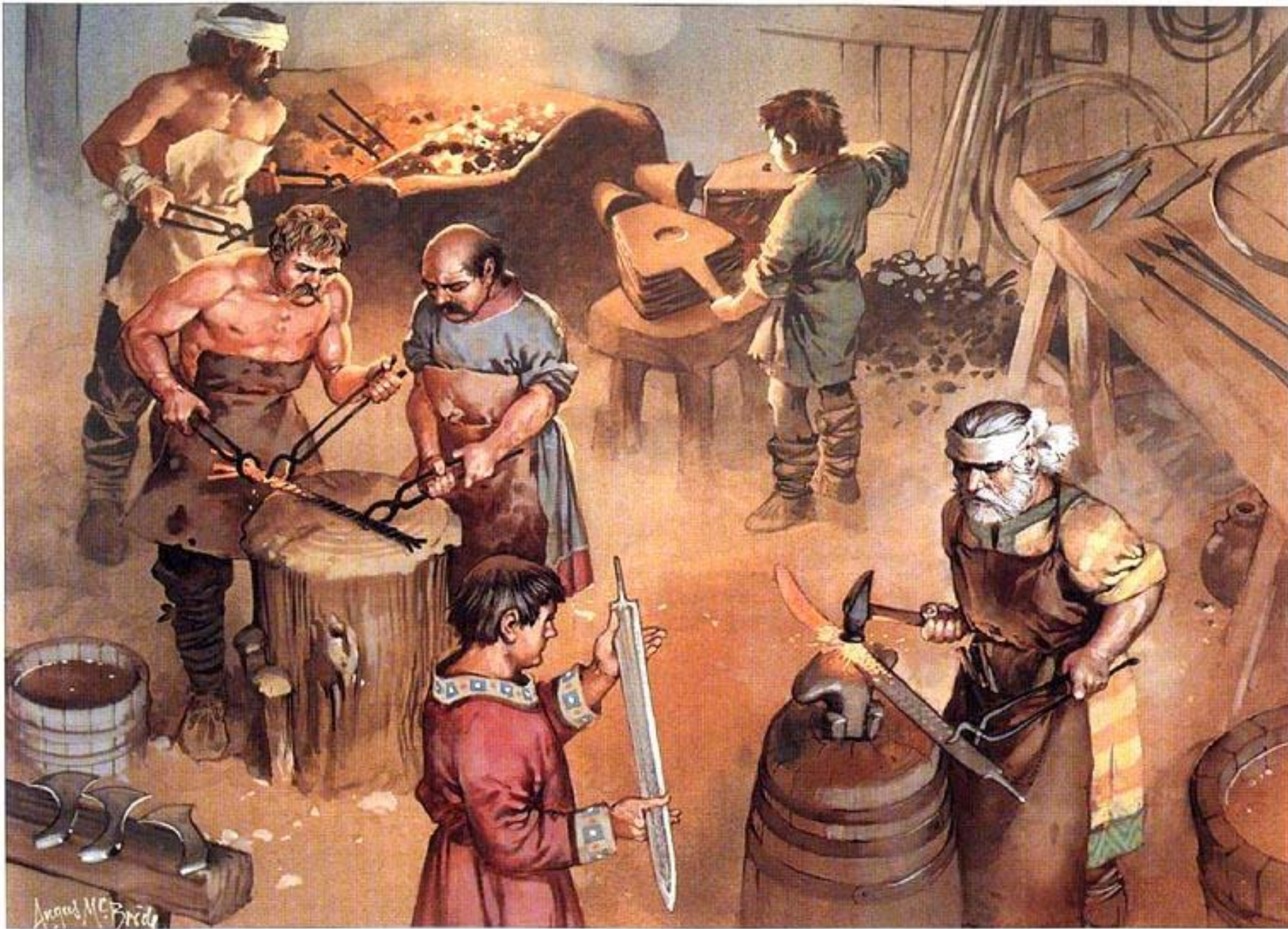
Weapons production, a Frankish workshop, 6th century