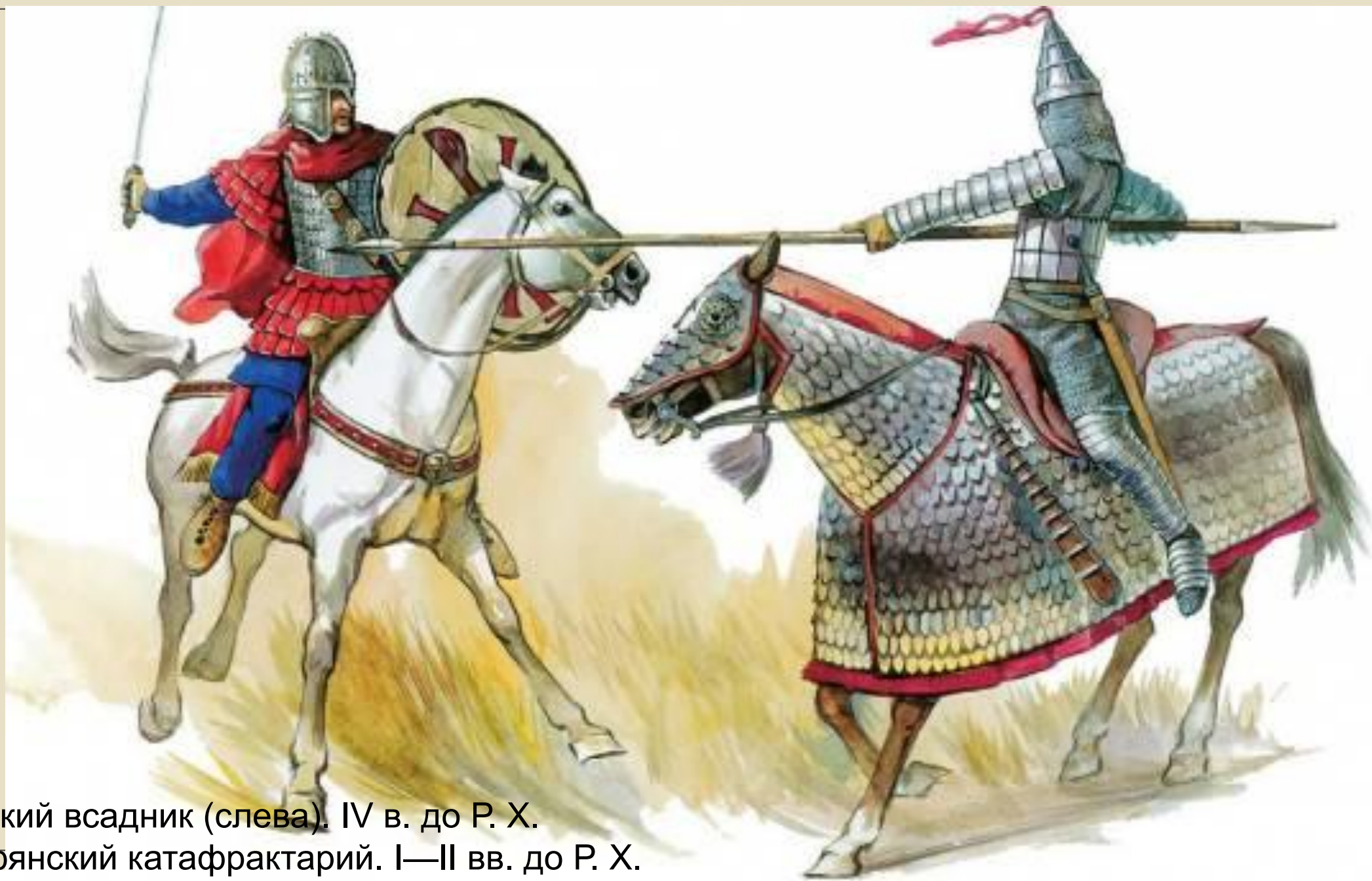
Римский всадник (слева). IV в. до Р. Х. Парфянский катафрактарий. I—II вв. до Р. Х.