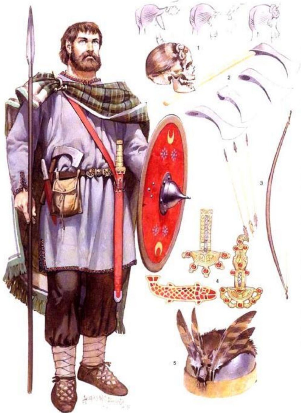
Alamannic warrior, 3rd-4th century AD (See text commentary for detailed captions)

Алеманнский воин (III-IV в.н.э.): 1 - "свевский узел" - традиционная прическа; 2 - франциска - метательный топор; 3 - германский лук; 4 - застёжки и броши; 5 - шлем с перьями.