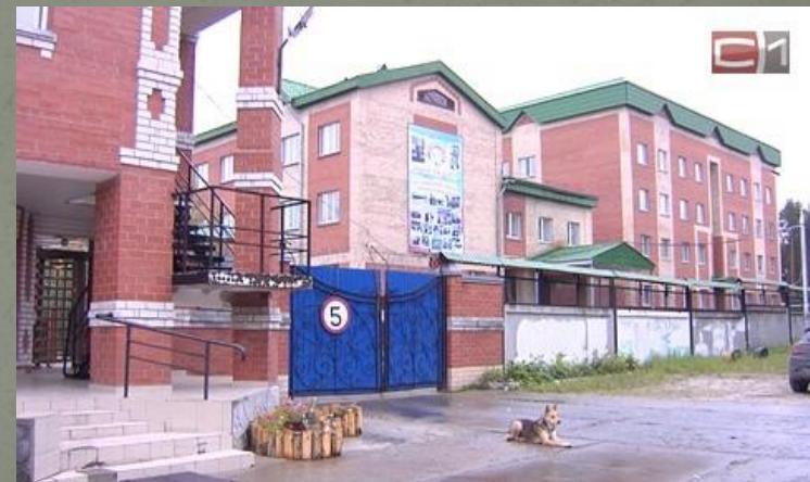
Спецшкола закрытого типа г. Сургут