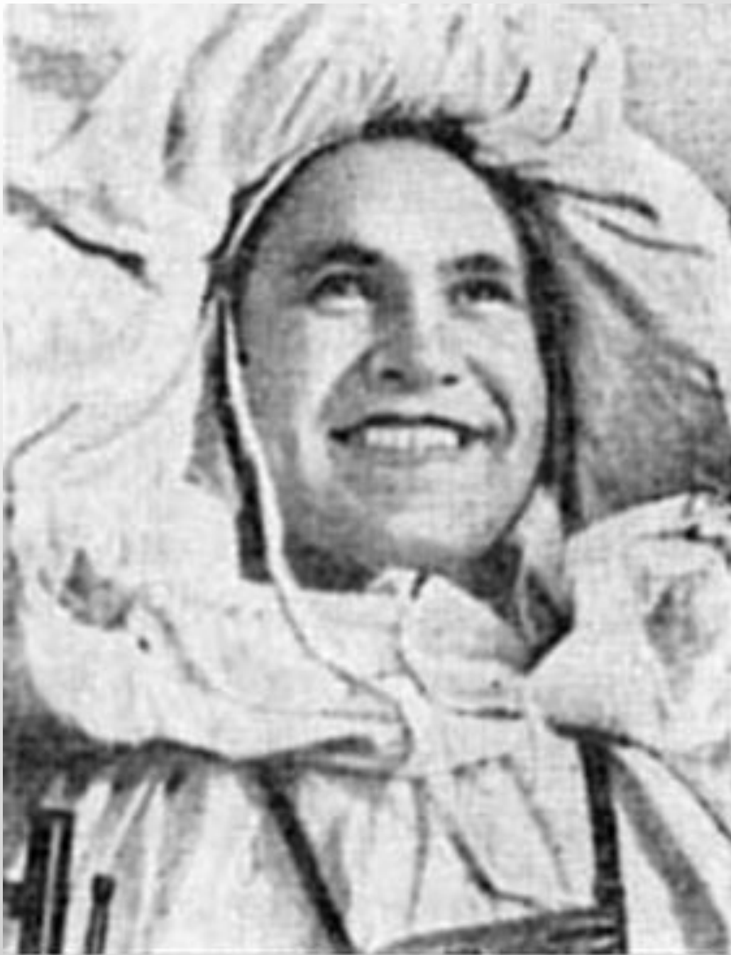
Зайцев Василий Григорьевич