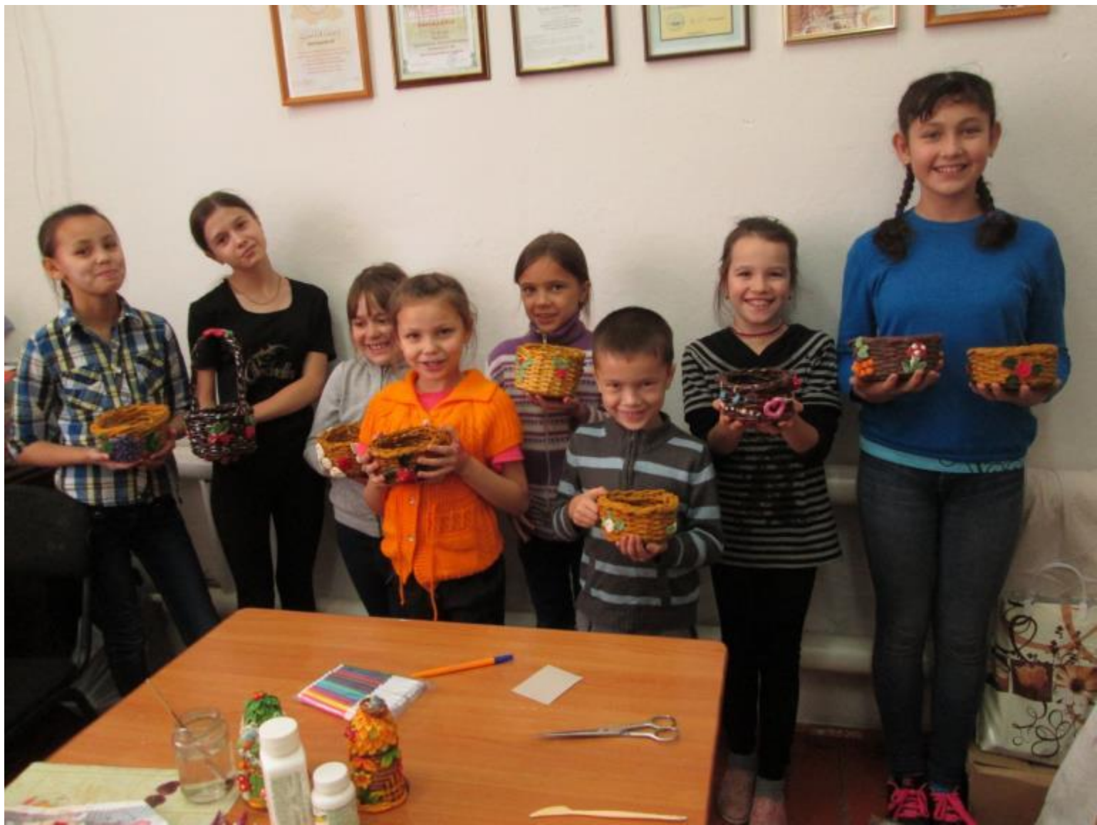
Дети со своими корзиночками