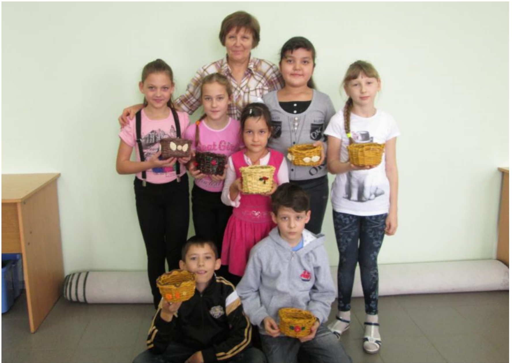
Дети со своими корзиночками