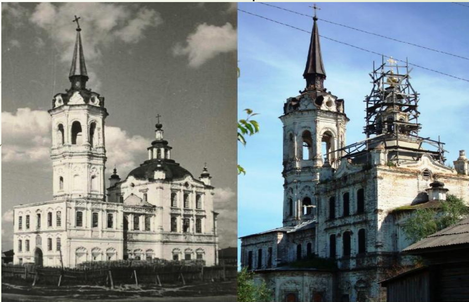
Тобольск. Крестовоздвиженская, Покровская церковь. Фото из интернета и сделанное мной в июле 2011 года