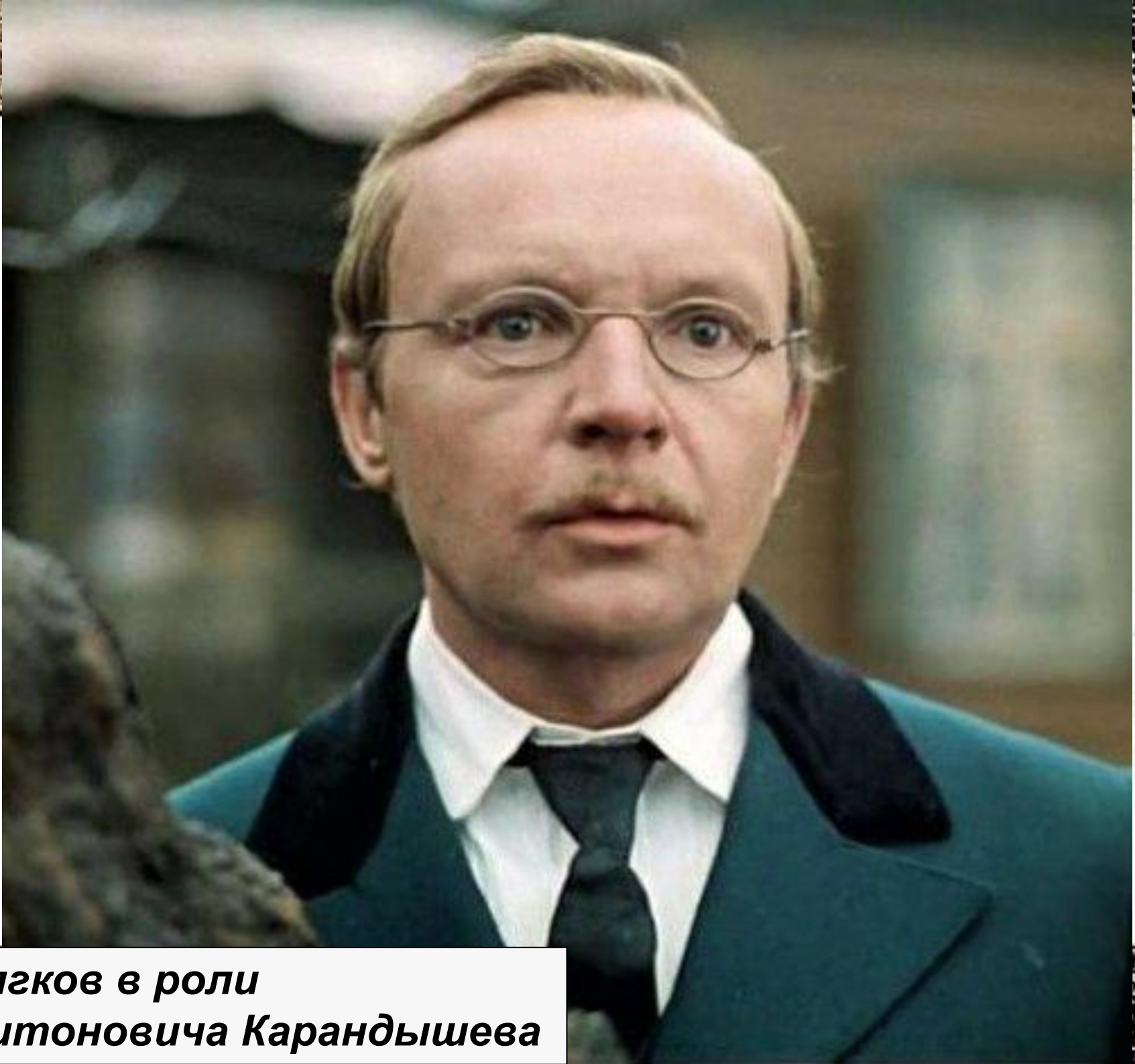
Андрей Мягков в роли Юлия Капитоновича Карандышева