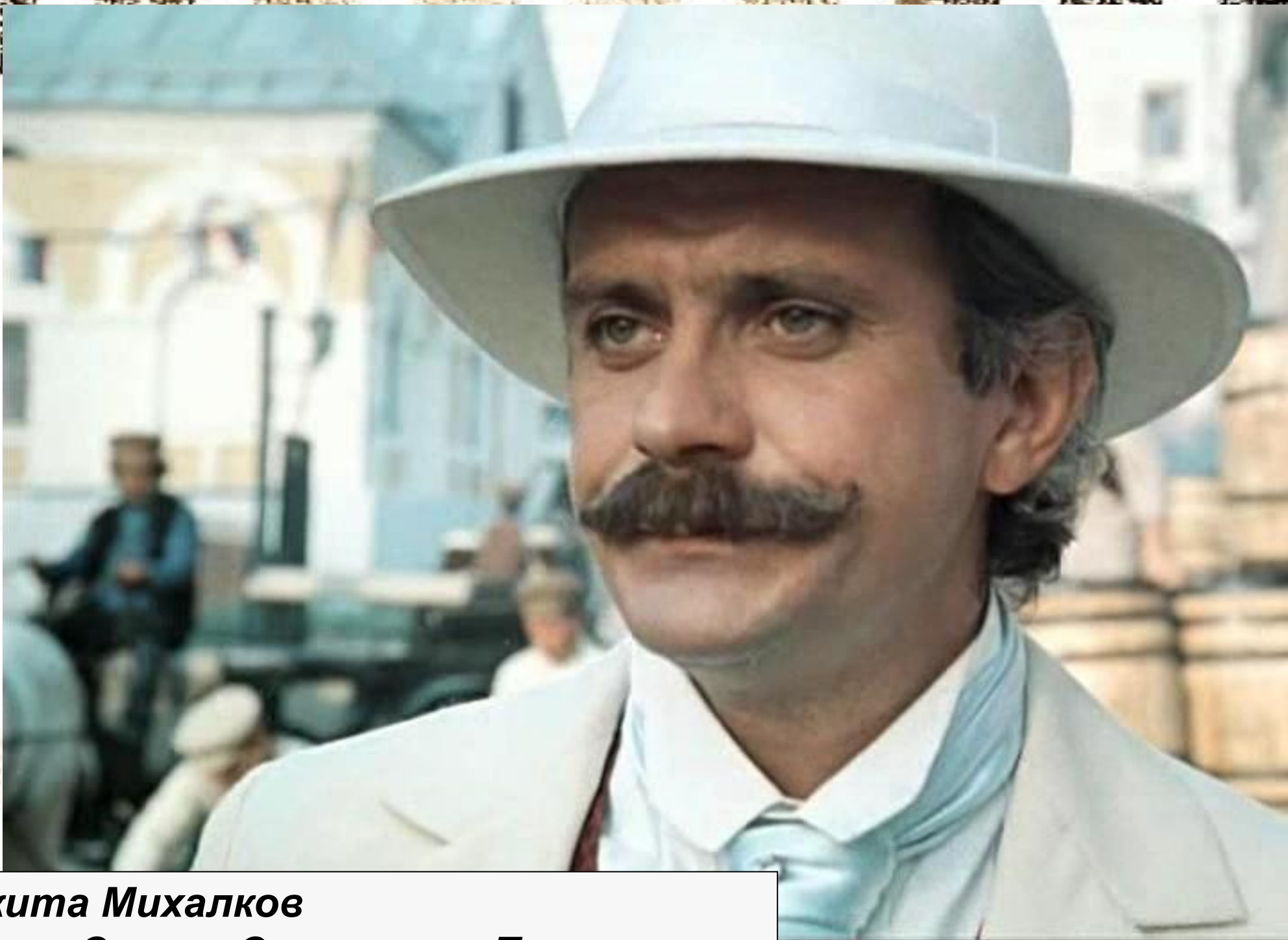
Никита Михалков в роли Сергея Сергеевича Паратова