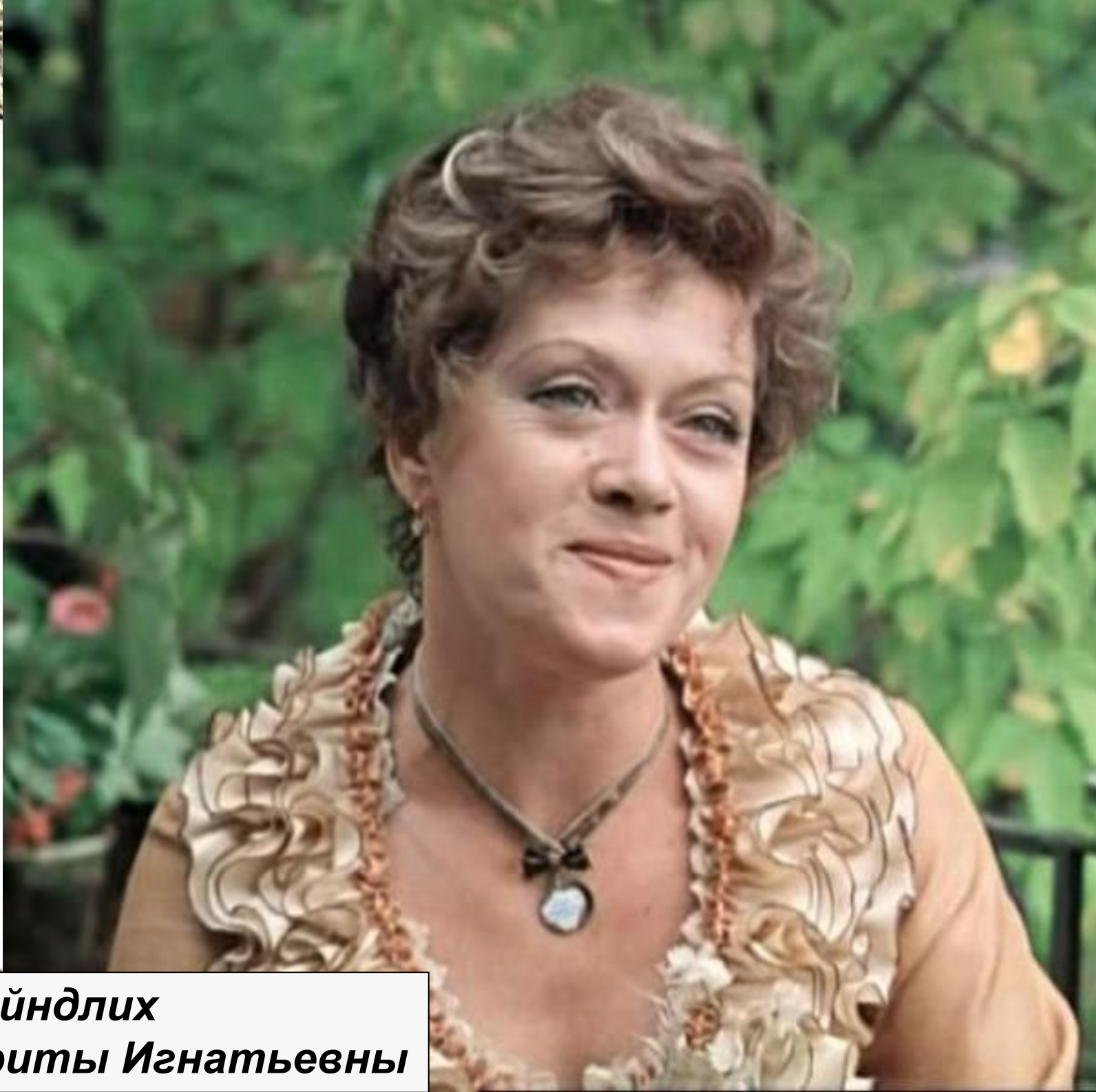
Алиса Фрейдлих в роли Хариты Игнатьевны