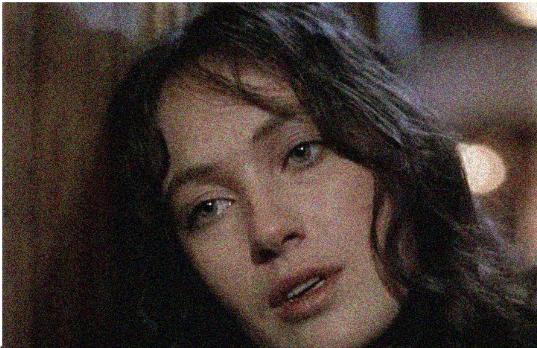
Лариса Гузеева в роли Парисы Огудаповой

Конечно же, огромную роль в создании такой необычной, профессиональной и красивой кинокартины сыграл актерский состав. И это прежде всего –