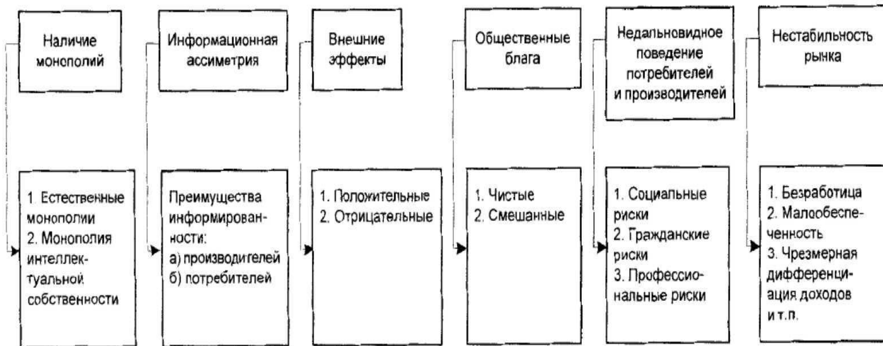
Рис. 2. Виды провалов рынка