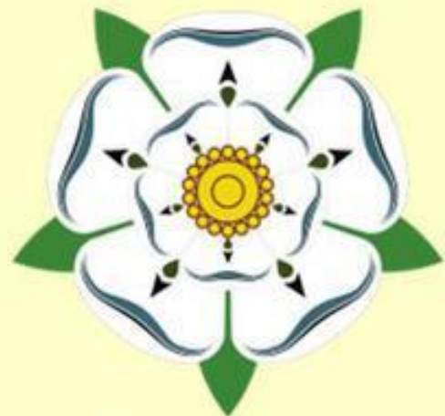
Белая Роза Йорков

После смерти в 1483 г. Эдуарда IV Йоркского и свержения его сына Эдуарда V престол захватил граф Ричард Глостер, брат Эдуарда IV.