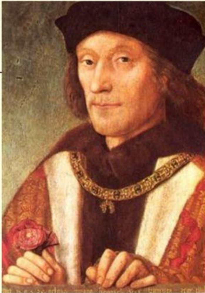
Генрих VII— король Англии и государь Ирландии (1485—1509), первый из династии Тюдоров.

В 1485 силы ланкастерцев во главе с Генрихом Тюдором высадились в Уэльсе. В сражении при Босворте Ричард III был убит, и корона перешла к Генриху Тюдору, короновавшемуся как Генрих VII, — основателю династии Тюдоров. В 1487 граф Линкольн (племянник Ричарда III) пытался вернуть корону Йоркам, но в сражении при Стоук Филде был убит.