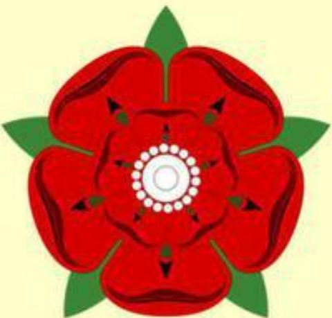
Алая роза Ланкастеров

Женившись на племяннице Ричарда III Елизавете Йоркской, Генрих VII заявил об объединении ранее враждовавших домов Йорков и Ланкастеров.