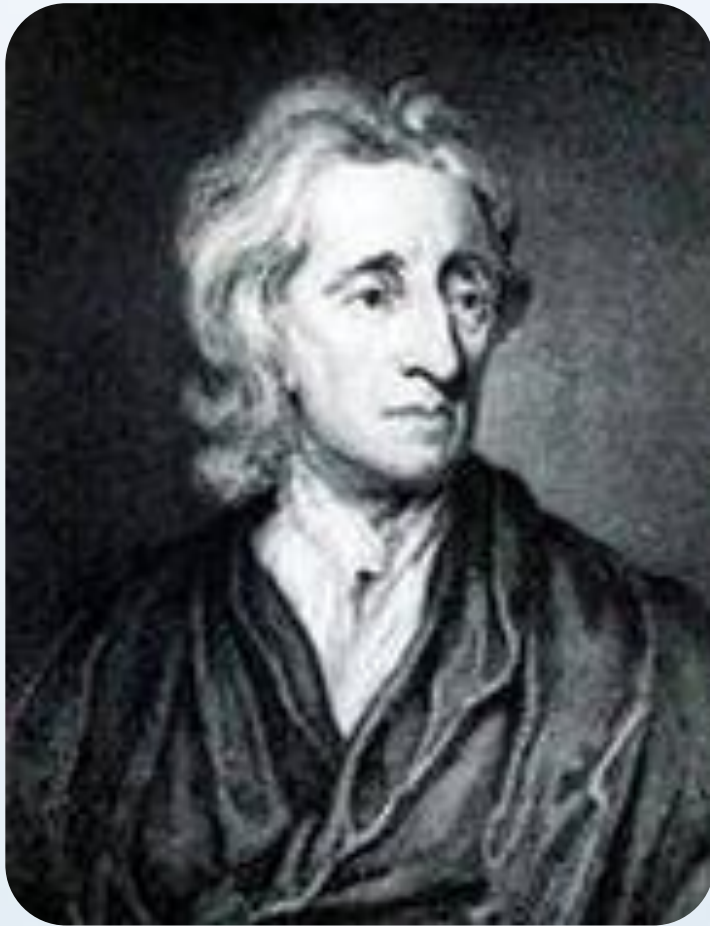
Джон Локк (29 августа 1632 г. — 28 октября 1704 г.) — британский педагог и философ, влиятельный мыслитель эпохи Просвещения.

«Человек рождается, имея право на полную свободу и неограниченное пользование всеми правами и привилегиями естественного закона в такой же мере, как всякий другой человек или любые другие в мире...»