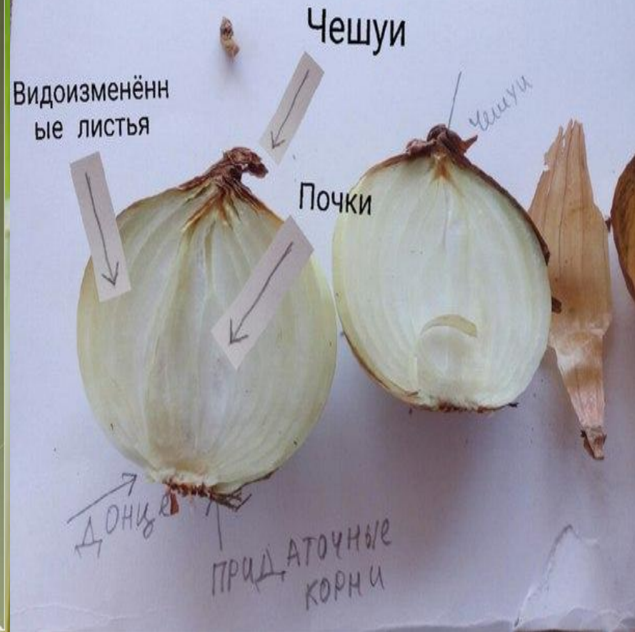
СХЕМА ИЗ ЛИТЕРАТУРЫ