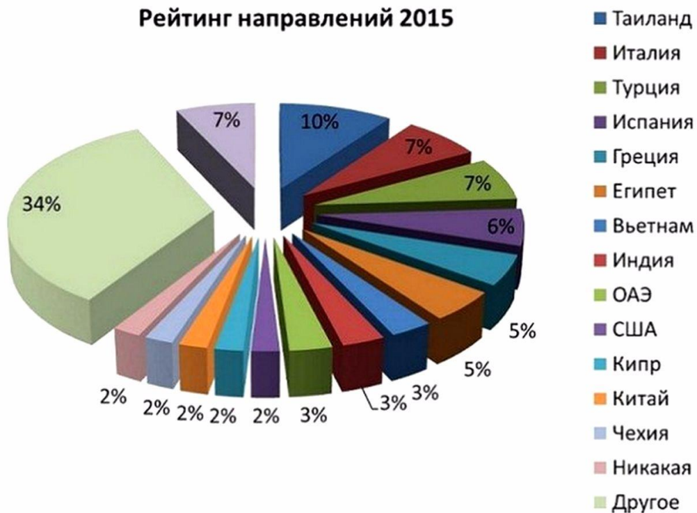
Рейтинг направлений 2015

Значительное расширение географии туристических поездок граждан России повысило риск гематогенных инфекций при донации крови.