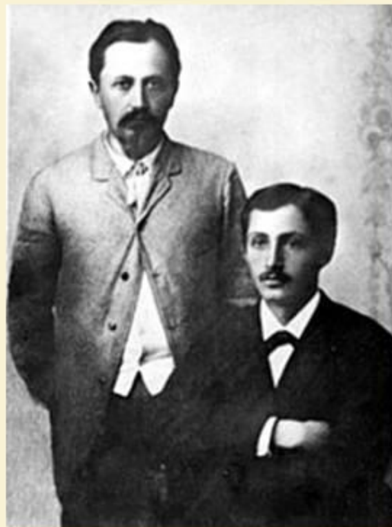
Юлий и Иван Бунины