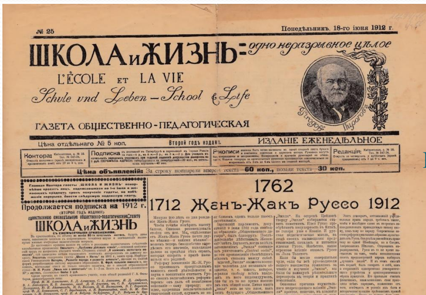
Еженедельная общественно-педагогическая газета "Школа и Жизнь", № 25, 18 июня 1912 года.

Официальными журналами были «Периодическое сочинение об успехах народного просвещения» (1803—1819), «Журнал Департамента народного просвещения» (1821—1824), «Журнал Министерства народного просвещения» (1834—1917).